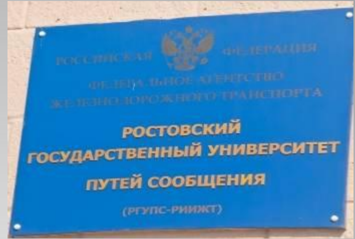
ВЫСШЕЕ УЧЕБНОЕ ЗАВЕДЕНИЕ РОСТОВСКОЙ ЖЕЛЕЗНОЙ ДОРОГИ