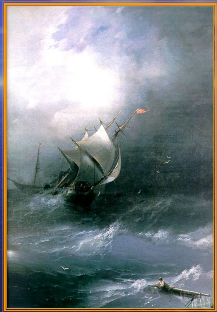
Буря на ледовитом океане 1864 год