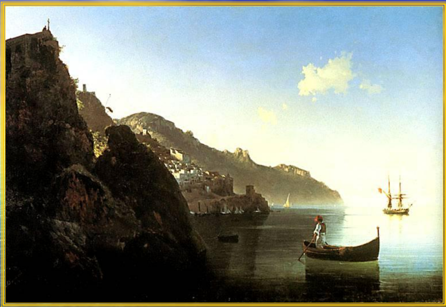
Побережье в Амальфи 1841 год