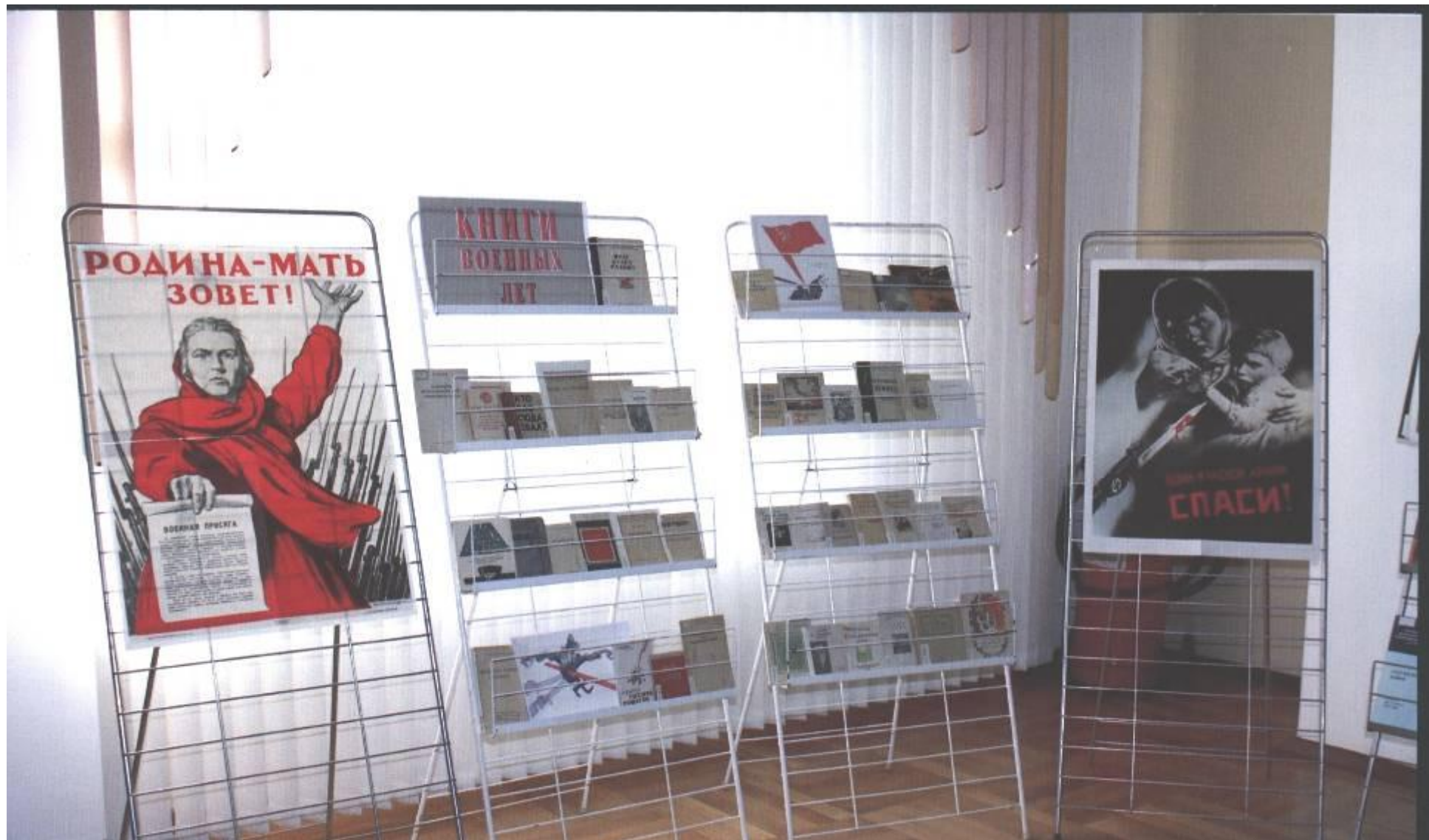
Выставка архивных документов «Вдали от огненной черты» на 35-м заседании законодательного Собрания Оренбургской области. Дом Советов г. Оренбург. 2010