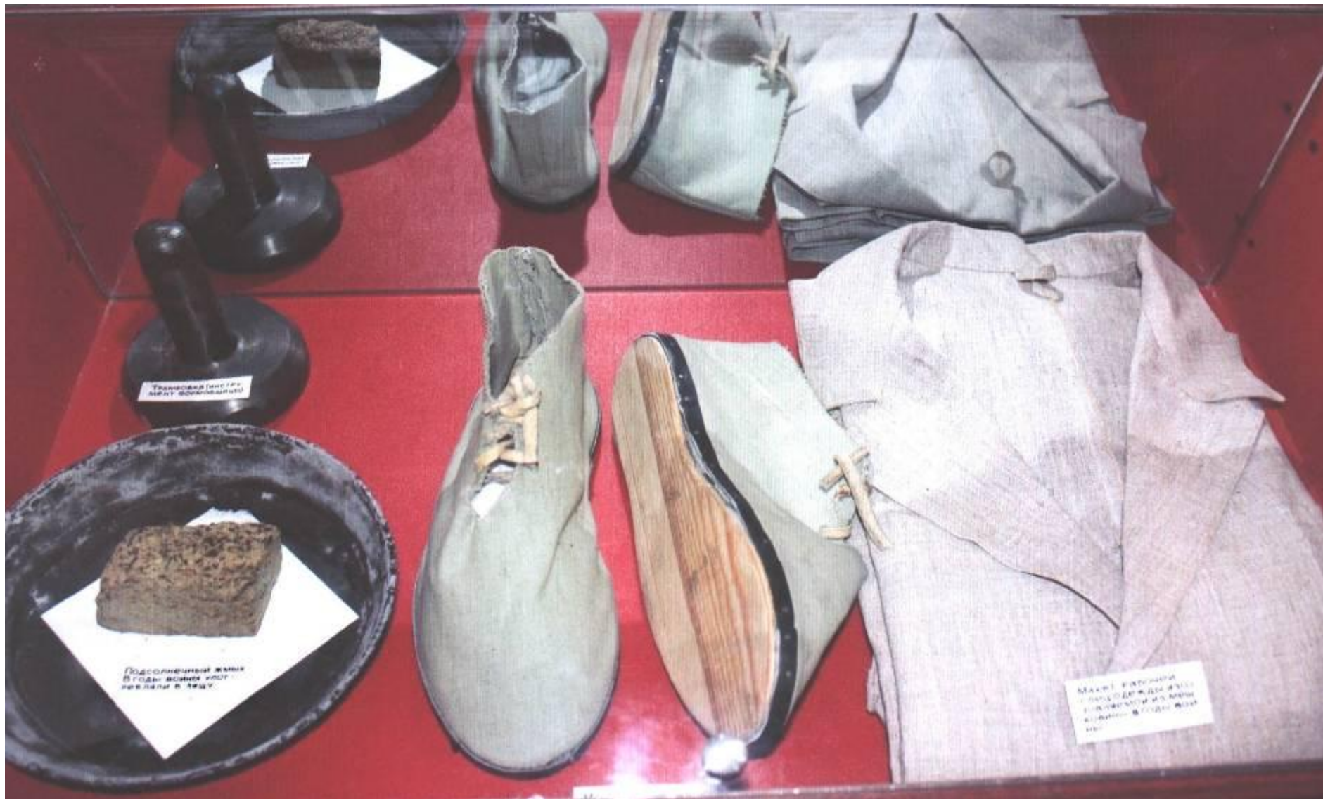
Экспозиция музея ООО «Оренбургский радиатор». Макеты обуви и рабочей одежды, изготавливаемой из мешковины в годы войны. 2010 г.