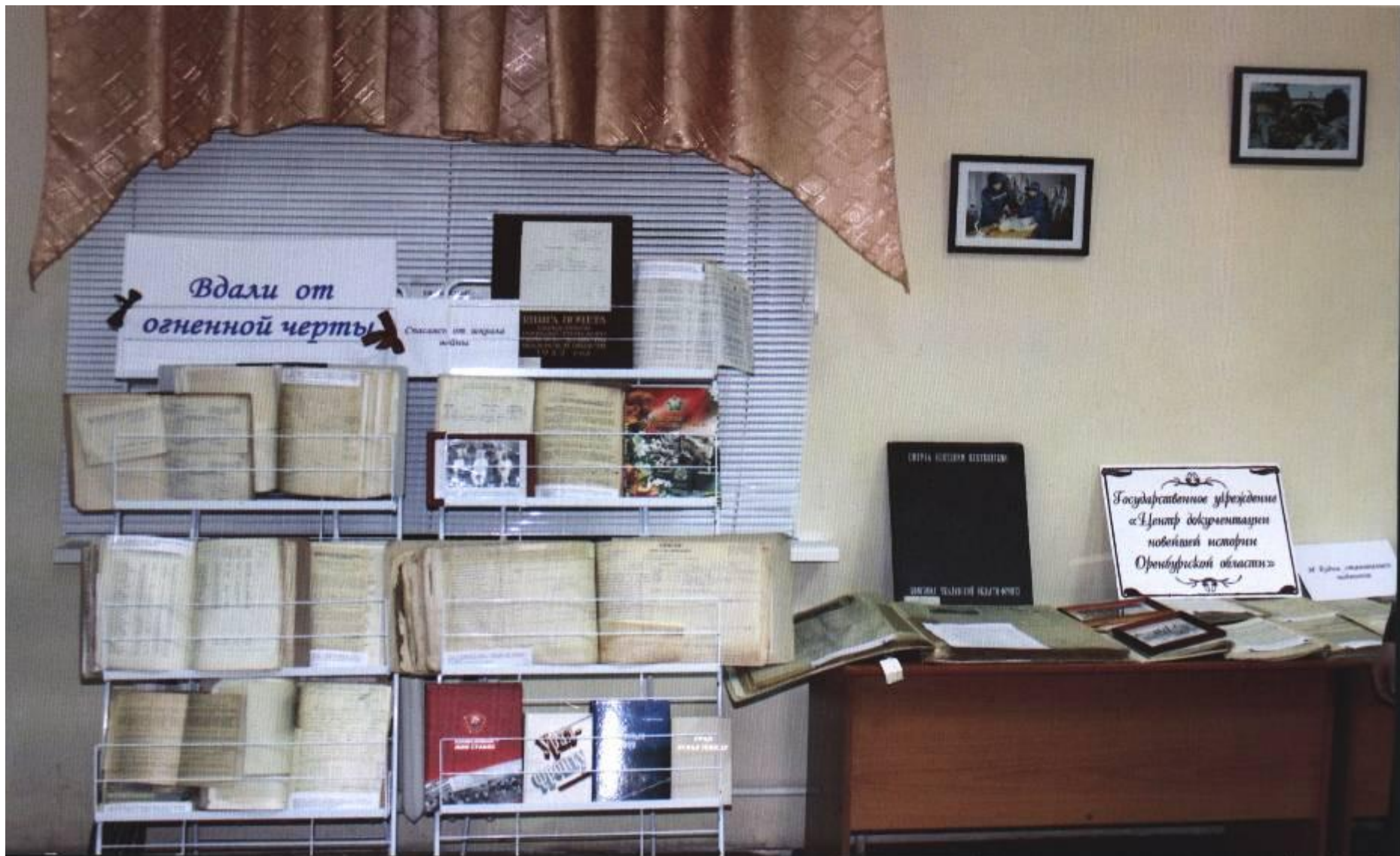
Выставка архивных документов «Вдали от огненной черты» на международной научной конференции «Великий подвиг Советского народа в Великой Отечественной войне (1941-1945 гг.) ФГОУ ВПО «ОГАУ» г. Оренбург. 2010