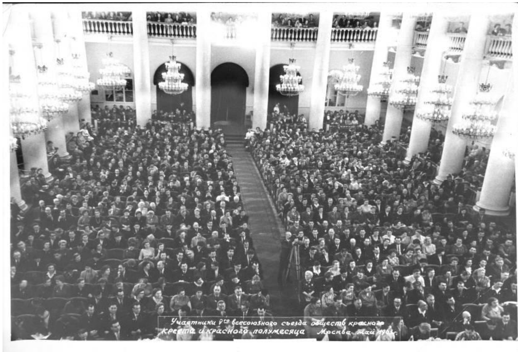
Участники 5-го Всесоюзного съезда обществ Красного Креста и Красного полумесяца СССР. 1963 г.