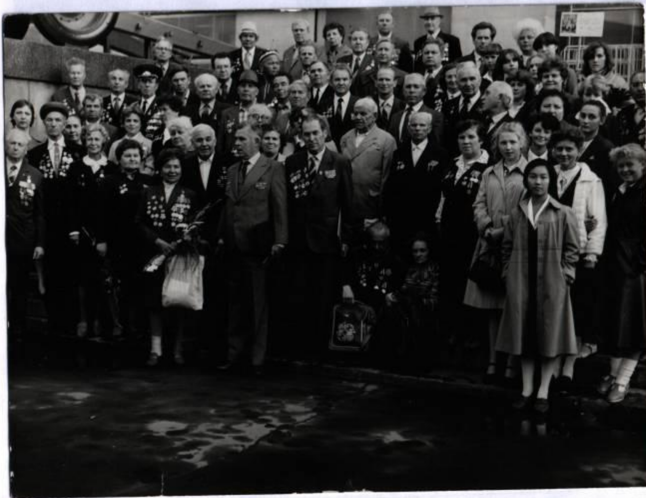
Встреча однополчан 184- ой стрелковой дивизии 5 –ой армии и шефы Фрезинской школы № 3 у здания ЦДСА г. Москва.