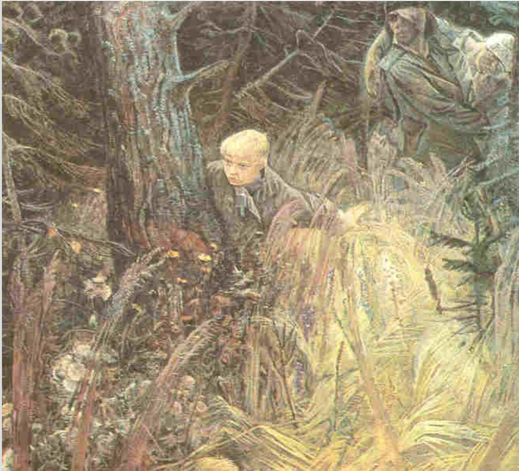
Н.И. Обрыньба «Первый подвиг»