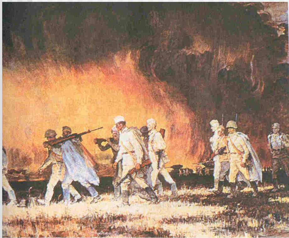
Ю.Непринцев «Вот солдаты идут»