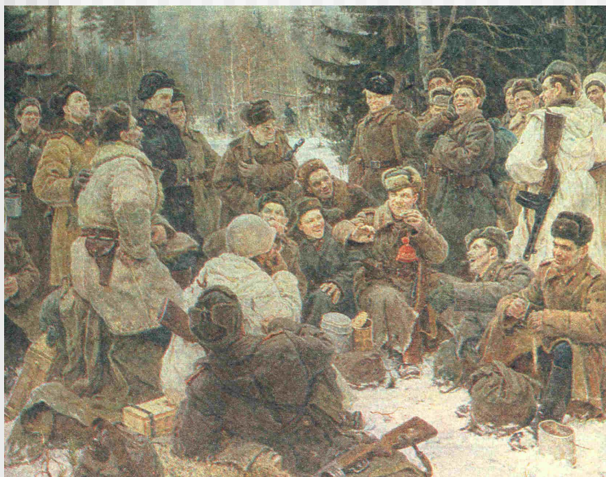
Ю. Непринцев «Отдых после боя».