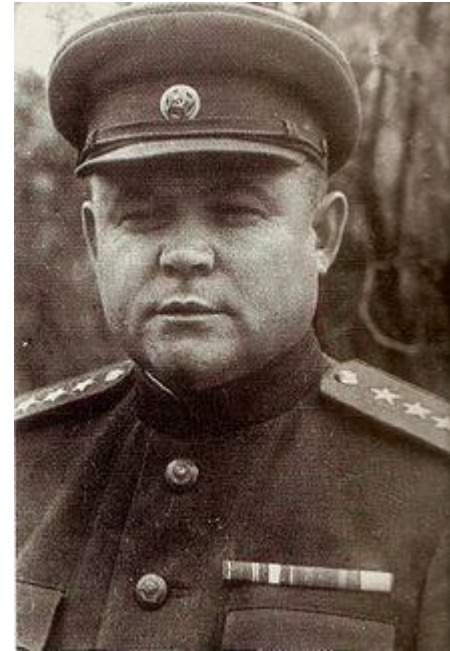
Генерал армии Н. Ф. Ватутин, 1943г.