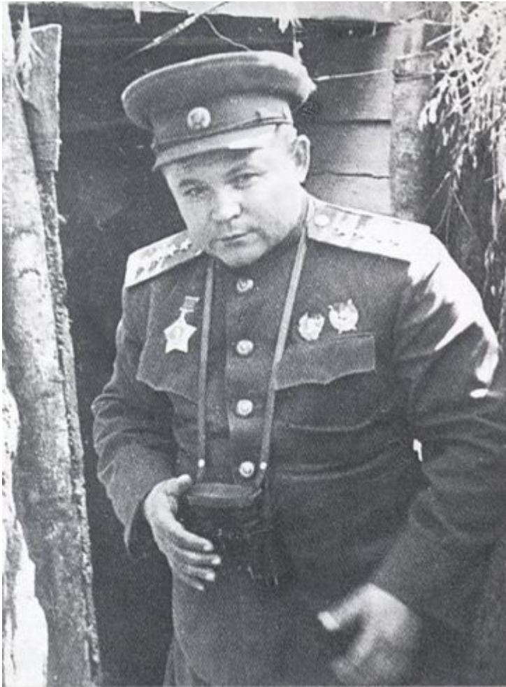
Генерал армии Н.Ф.Ватутин