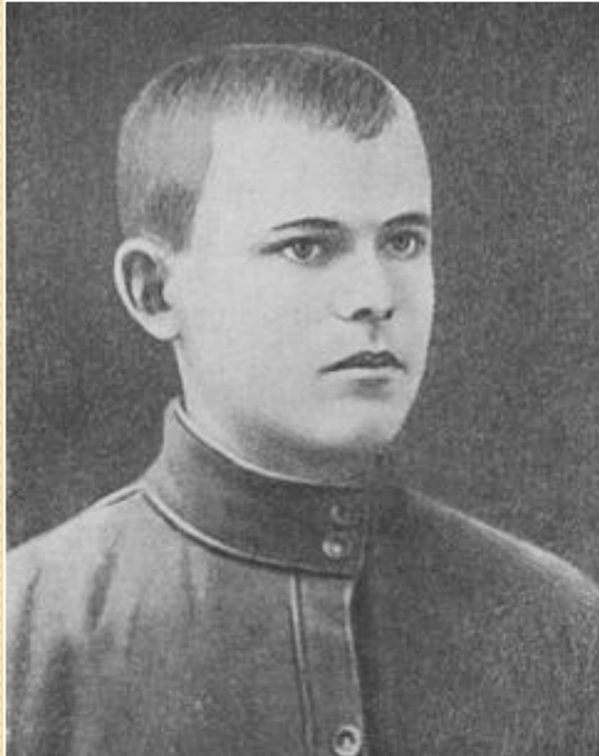
Н.Ф.Ватутин. 1929 г.