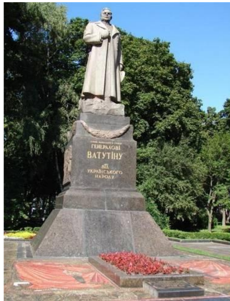
Памятник Н. Ф. Ватунину в Мариинском парке Памятник Н. Ф. Ватунину в Мариинском парке в Киеве Памятник Н. Ф. Ватунину в Мариинском парке