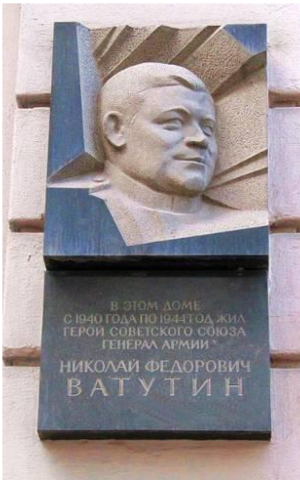
Памятная доска по адресу: Москва, Б.Ржевский пер., 11. Н. Ф. Ватутин проживал здесь в 1940-1944 гг.