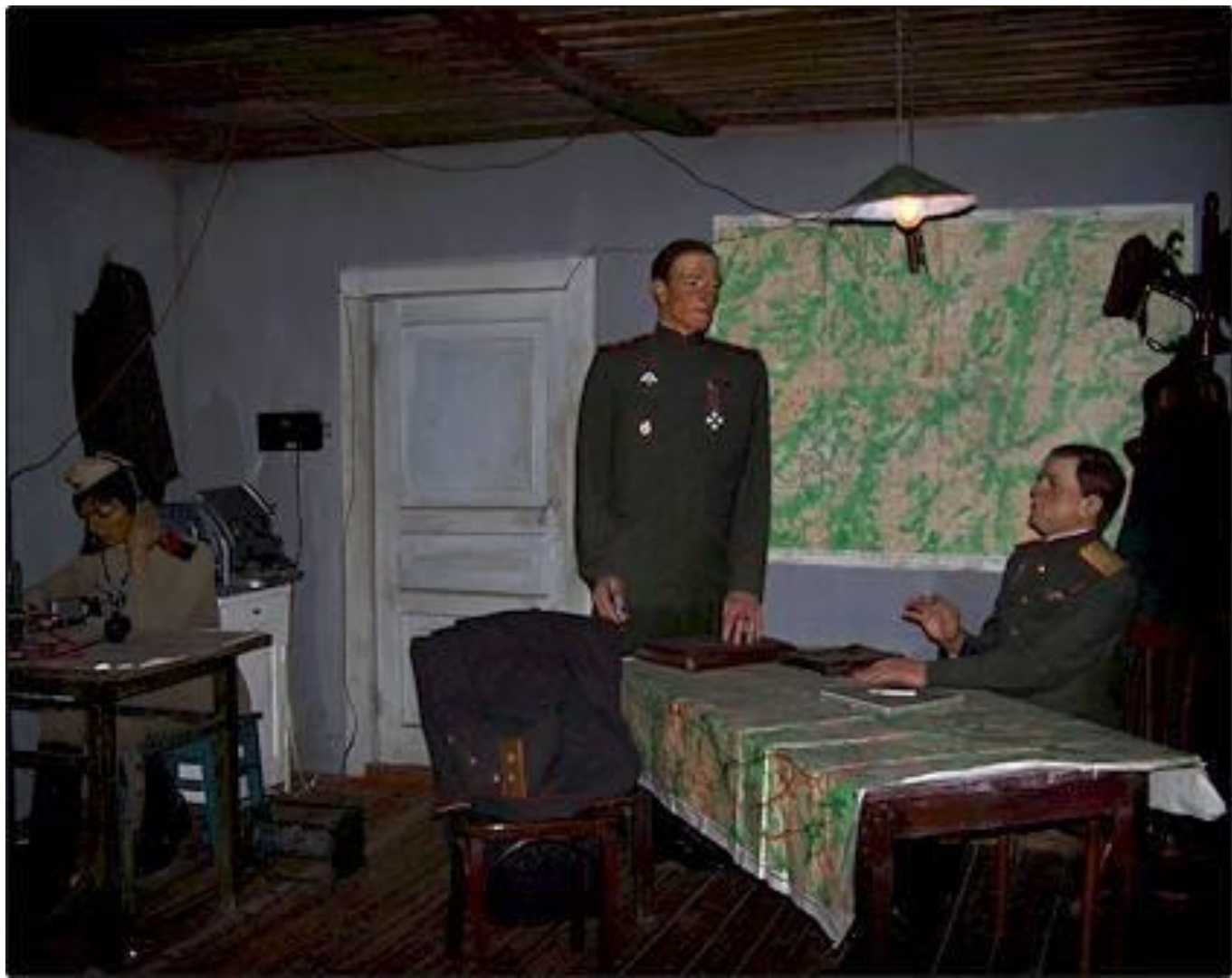
Встреча в штабе Воронежского фронта генерала армии Ватутина Н.Ф., командующего Воронежским фронтом и генерал-лейтенанта Катукова М. Е., командующего 1 танковой армией перед Курской битвой. Лето 1943. Белгородская диорама