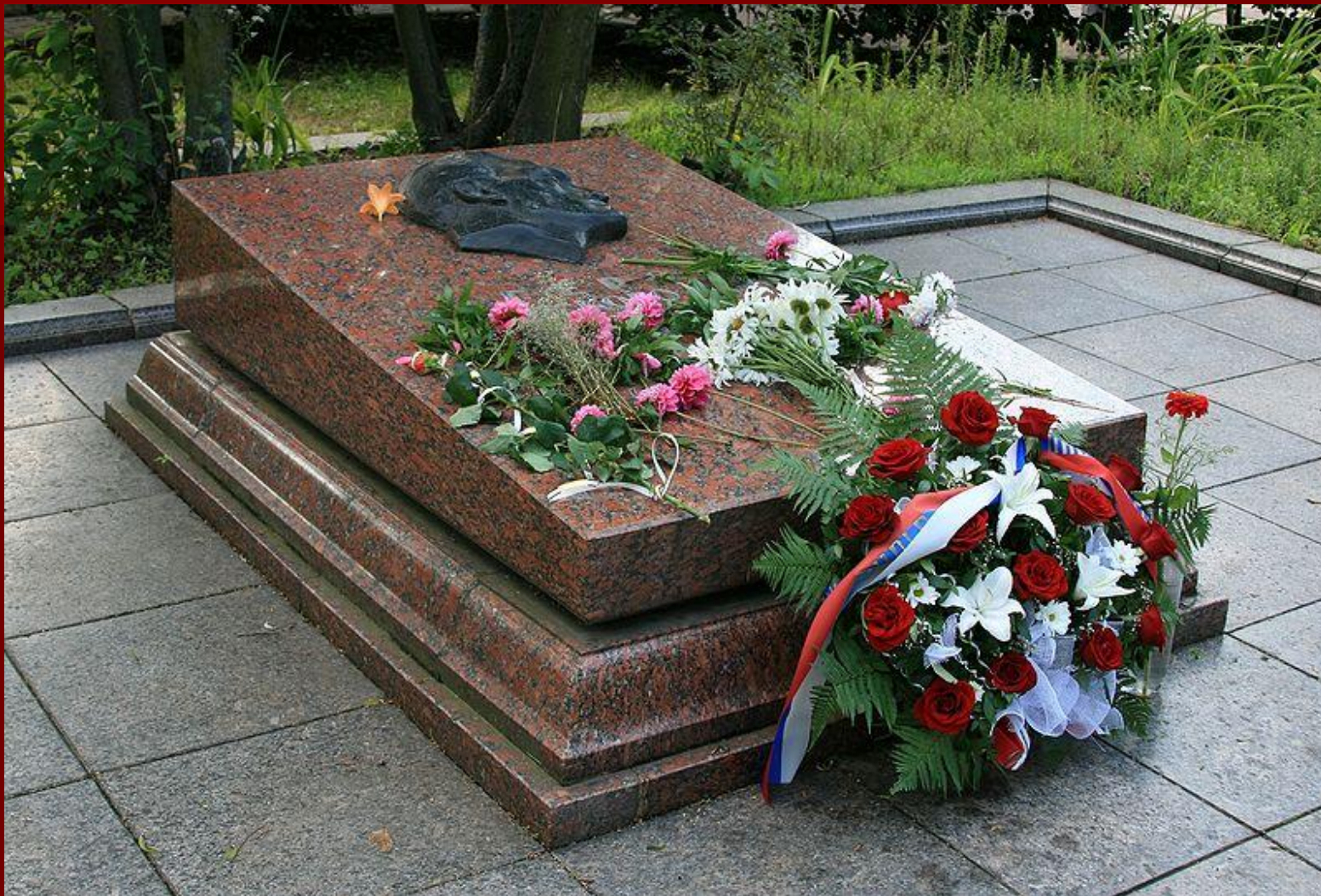
Могила разведчика Николая Кузнецова на Холме Славы во Львове.