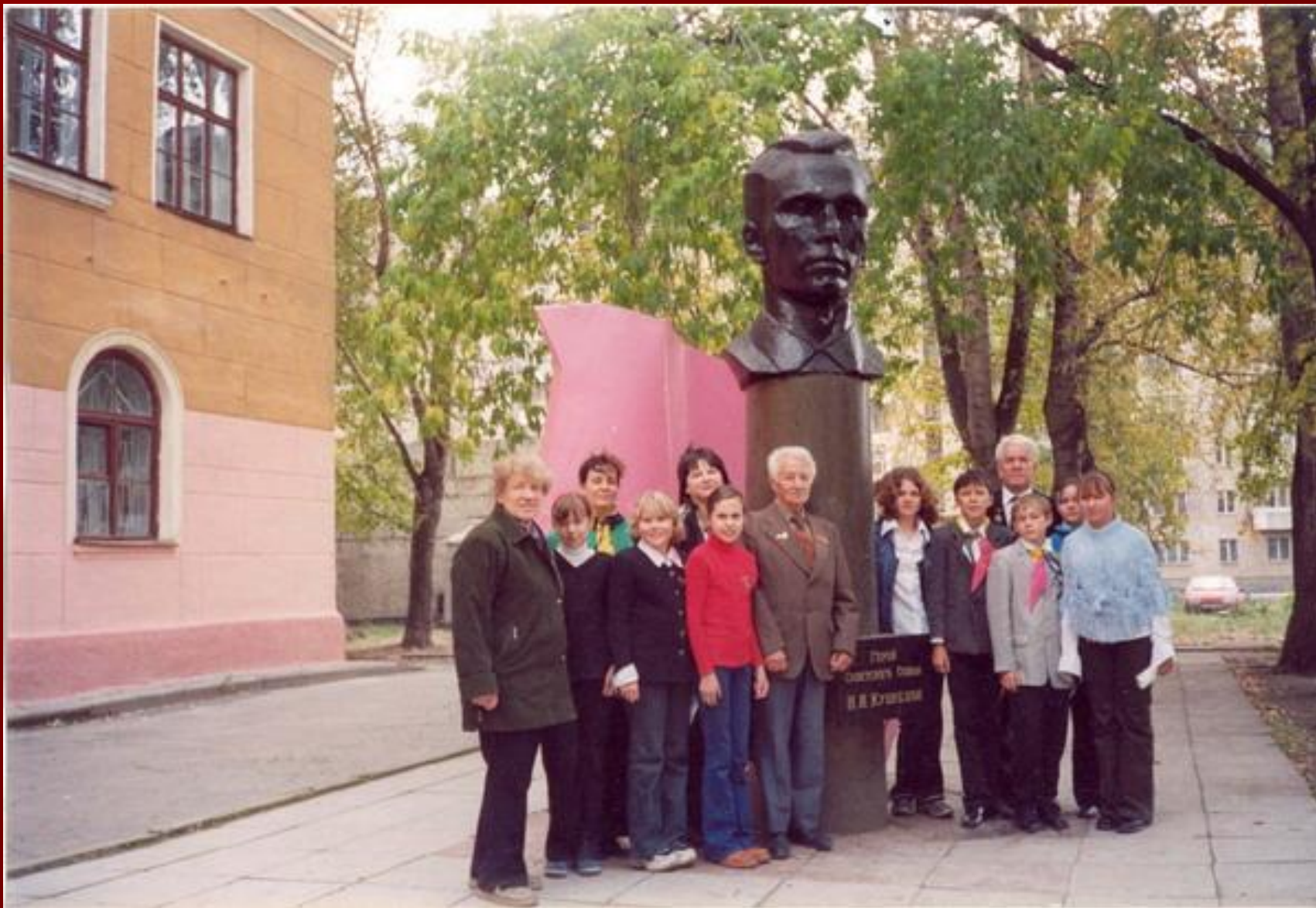
В 1964 г. жители города Талицы Свердловской области воздвигли памятник своему замечательному земляку