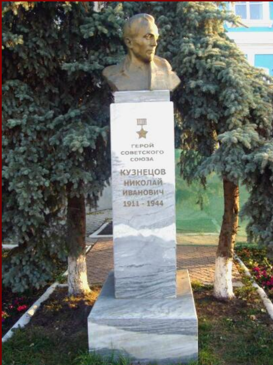
Бюст в Тюмени установлен на улице Республики, дом № 7