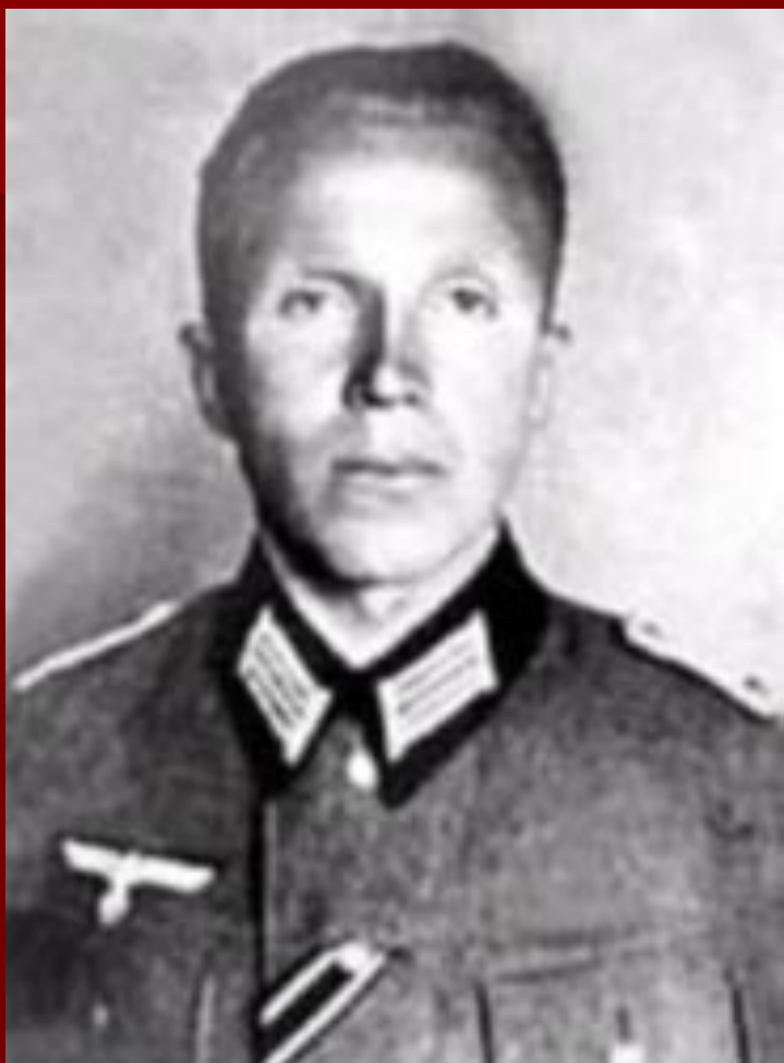
Немецкий офицер Пауль Вильгельм Зиберт