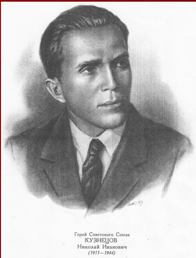
Герой Советского Союза КУЗНЕЦОВ Николай Иванович (1911—1944)

Легендарный разведчик специального партизанского отряда старший лейтенант Н. И. Кузнецов обладал исключительной выдержкой и хладнокровием. Действия его были смелыми до дерзости. Он проникал в логово врага, в фашистские штабы и учреждения. Доблестный патриот уничтожил фашистских палачей, действовавших на Украине: главного судью Функа, заместителя Коха генерала Кнута, фашиста Геля, похитил генерала фон Ильгена, командовавшего особыми карательными войсками, и др.