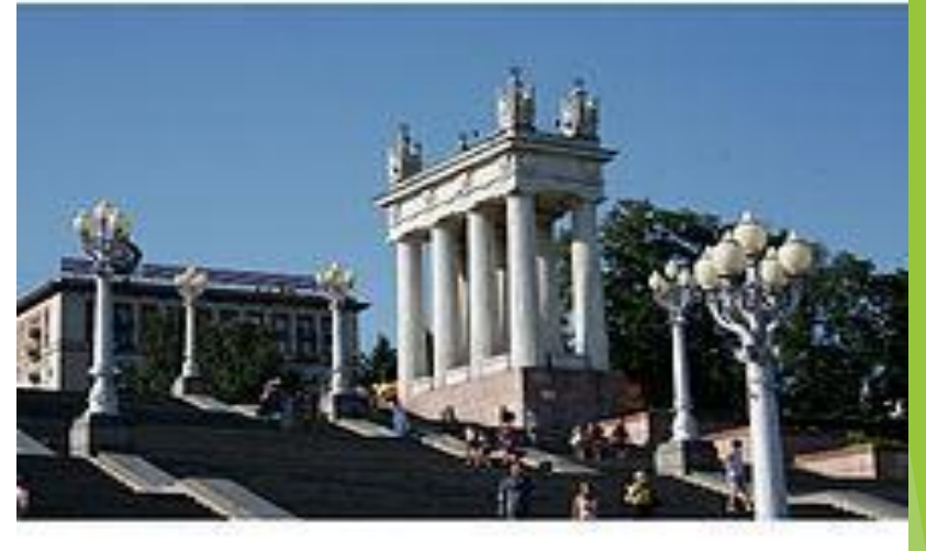
Набережная имени 62-й армии.

( http://www.youtube.com/watch?v=Vy9Zak86e6 )