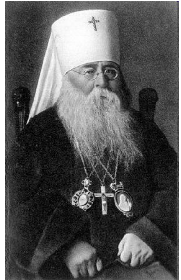
Патриарх Сѣргий (1943-1944)

В сентябре 1943 г. состоялась встреча руководителей Русской православной церкви со Сталиным , который пошел навстречу их пожеланиям и разрешил избрать нового патриарха