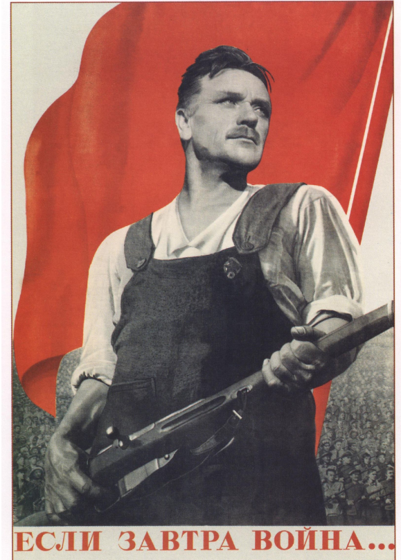
107. Корецкий В. Если завтра война... 1938

Люди впервые остро осознали, что сейчас решается судьба не только советской власти, но и самой страны