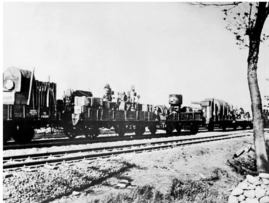
Эвакуация на Восток

Уже за первые пять месяцев войны удалось направить более 1500 крупных промышленных предприятий и свыше 10 млн. человек