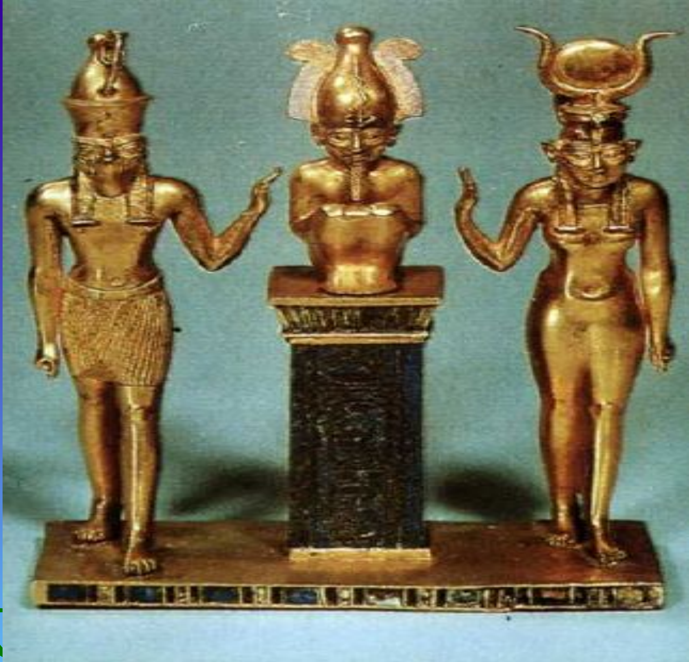
Гор, Осирис и Исида.