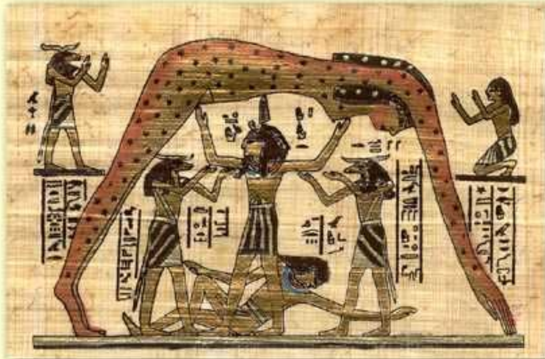
Гиб и Нут