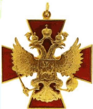
Орден за Заслуги перед Отечеством 1 степени