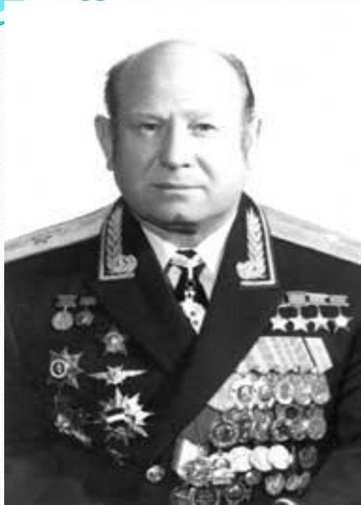
Леонов Алексей Архипович Дважды Герой Советского Союза

18-19 марта 1965 года совершил космический полёт в качестве второго пилота космического корабля «Восход-2» (командир – полковник П.И.Беляев) продолжительностью 1 сутки 2 часа. В ходе полёта 18 марта 1965 года выполнил первый в мире выход в открытый космос продолжительностью 23 минуты 41 секунда. Во время выхода проявил исключительное мужество, особенно в нештатной ситуации, когда разбухший космический скафандр препятствовал возвращению космонавта в космический корабль.