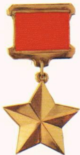
Медаль «Золотая Звезда»