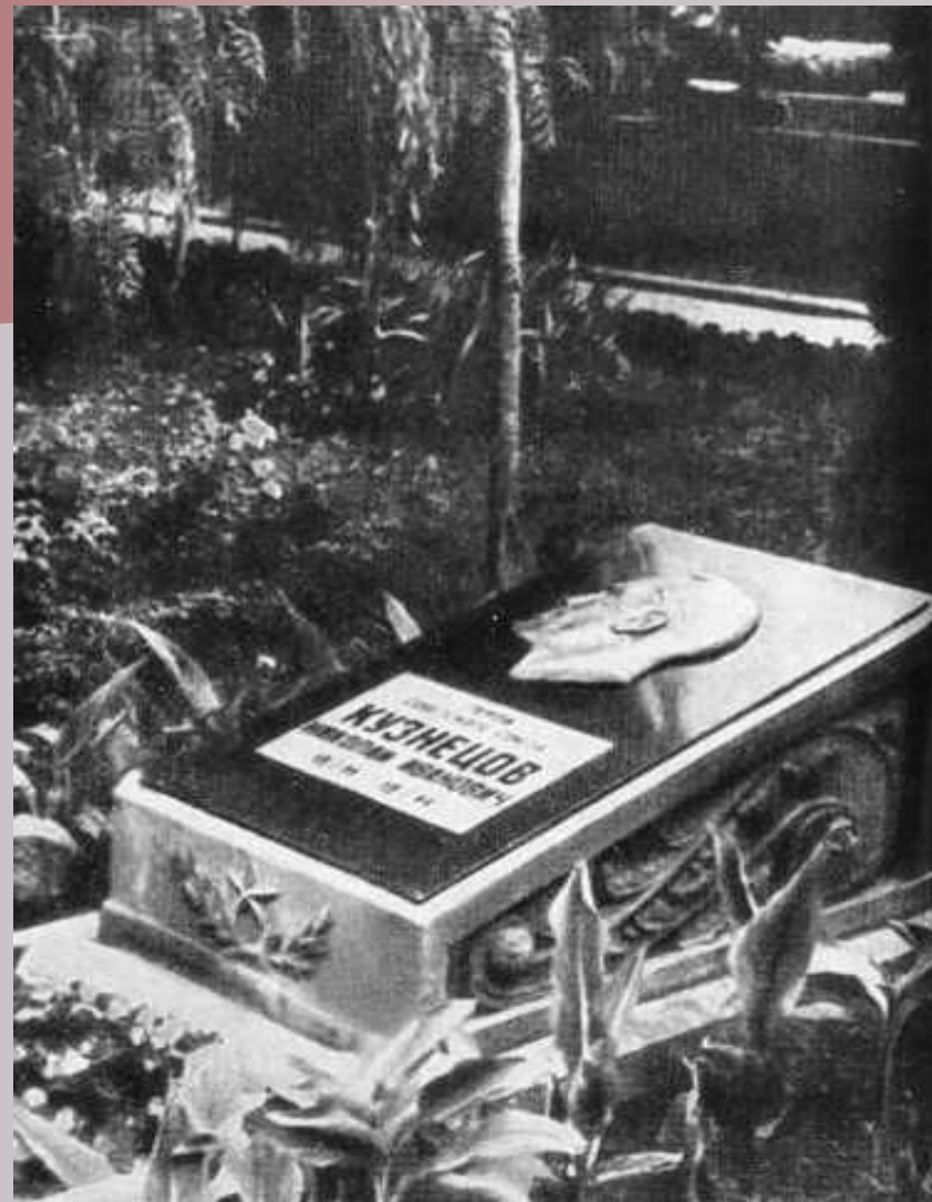
У могилы Н.И. Кузнецова в г. Львове на Холме Славы