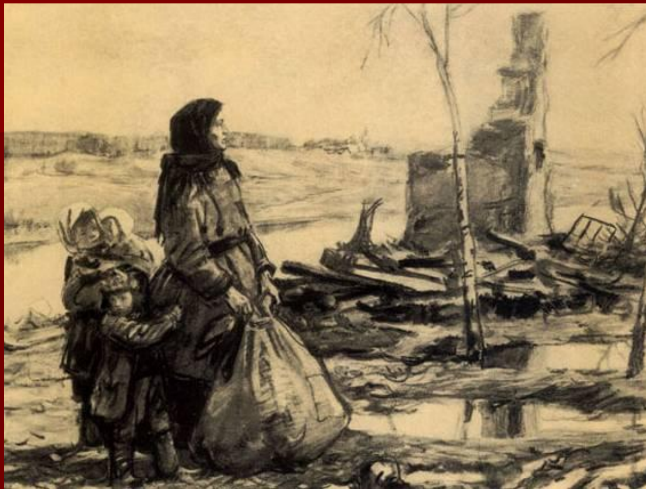
Д.Шмаринов. «Не забудем, не простим»