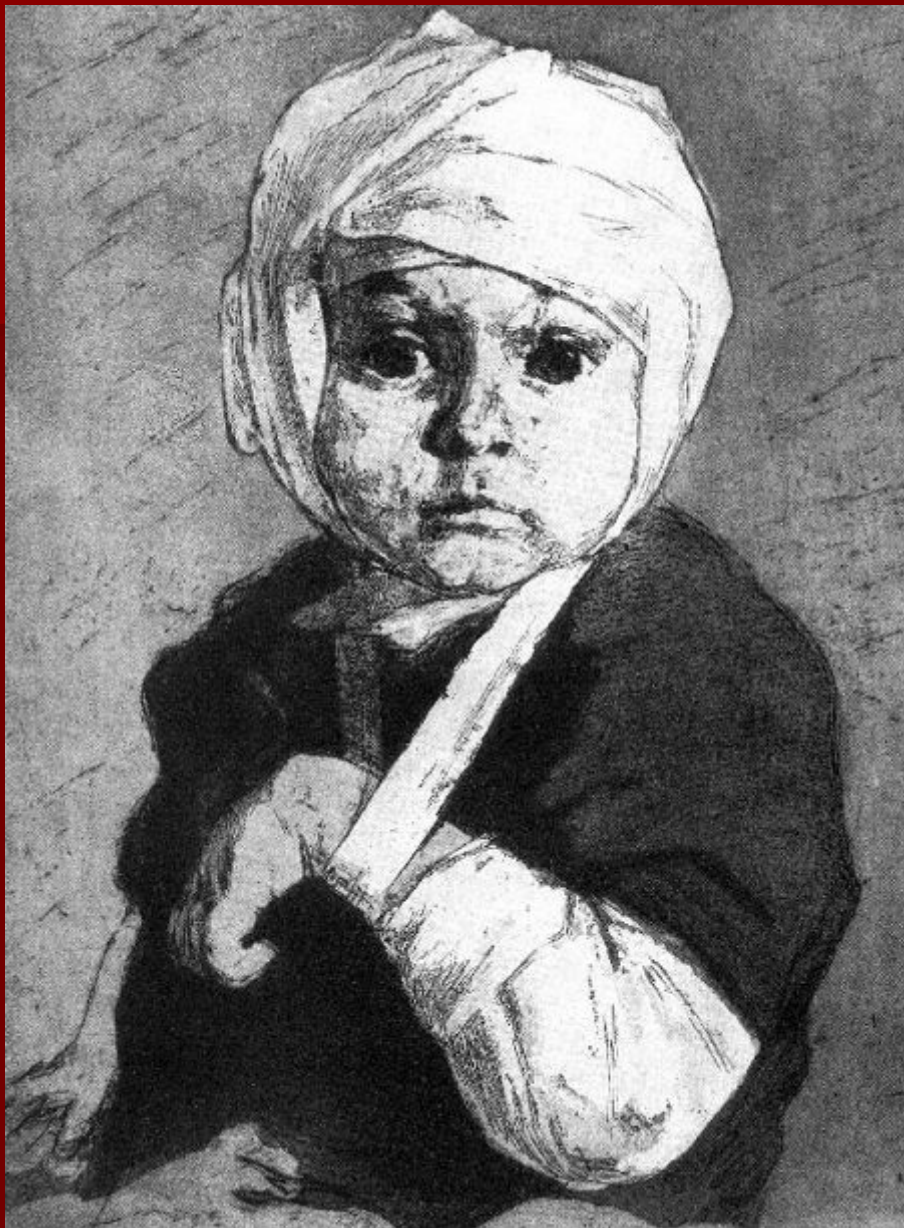
А. Харшак «За что?» (Раненый ребенок) 1942