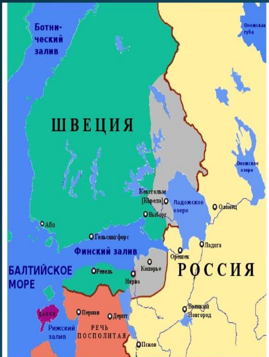
Территориальные изменения по Тязвинскому миру 1595. Территории, отданные России Швецией, показаны оранжевым.