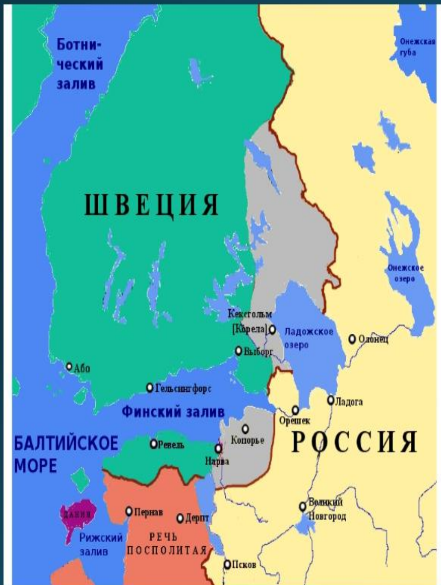
Границы по Плюсскому перемирию 1583 года. Земли, отторгнутые Швецией у России, отмечены серым цветом.