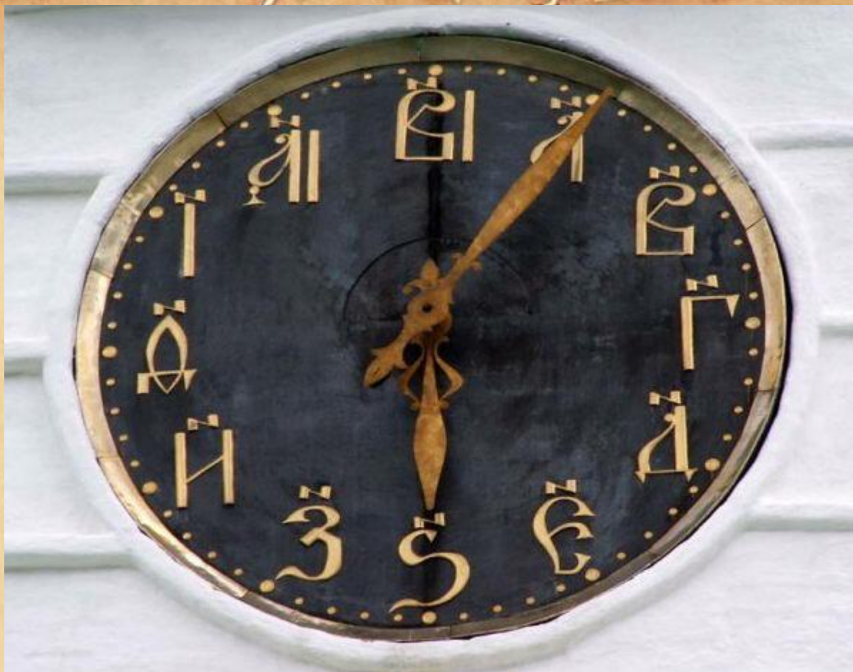
Башенные часы с Кириллическими числами в Суздале