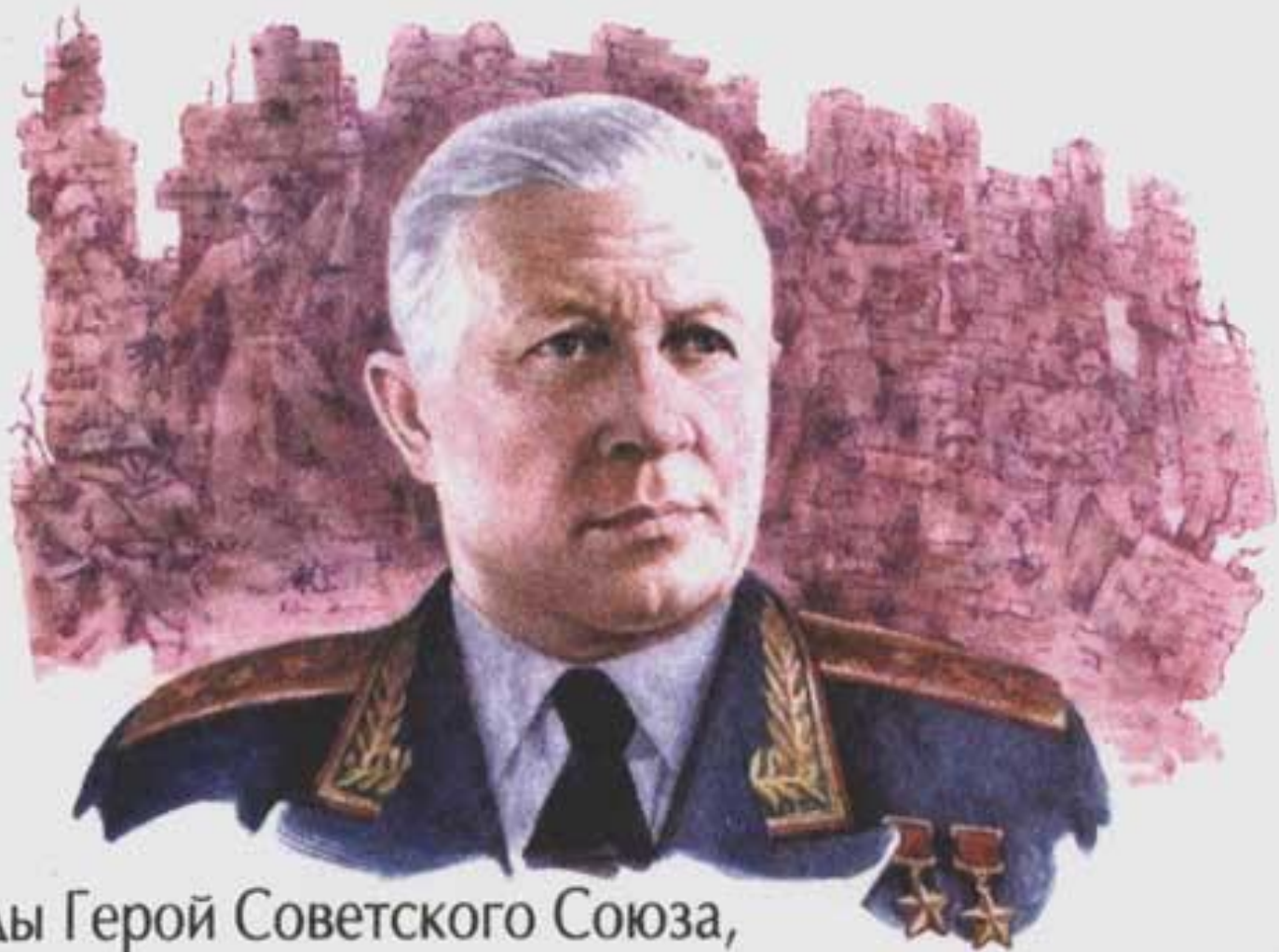
Дважды Герой Советского Союза, военачальник, генерал-полковник А.И. Родимцев · 1905–1977