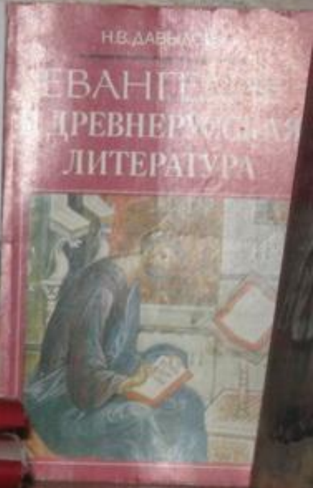
Основы православной культуры