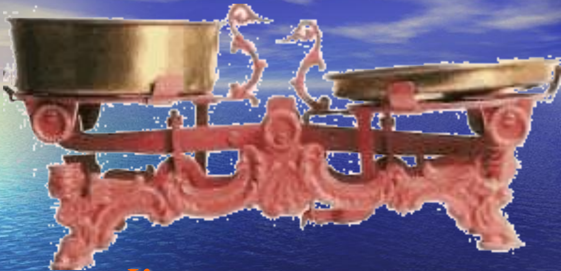
Коромысленные весы (Франция - 1669г.)