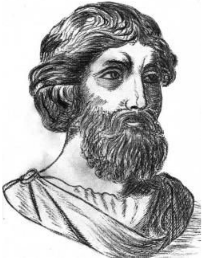
Пифагор. 570 – 495 г. до н.э.