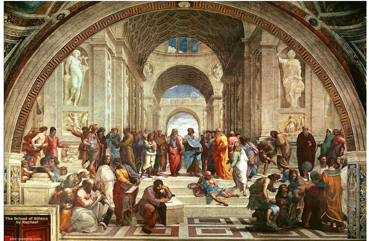
Пифагор на фреске Рафаеля 1509.