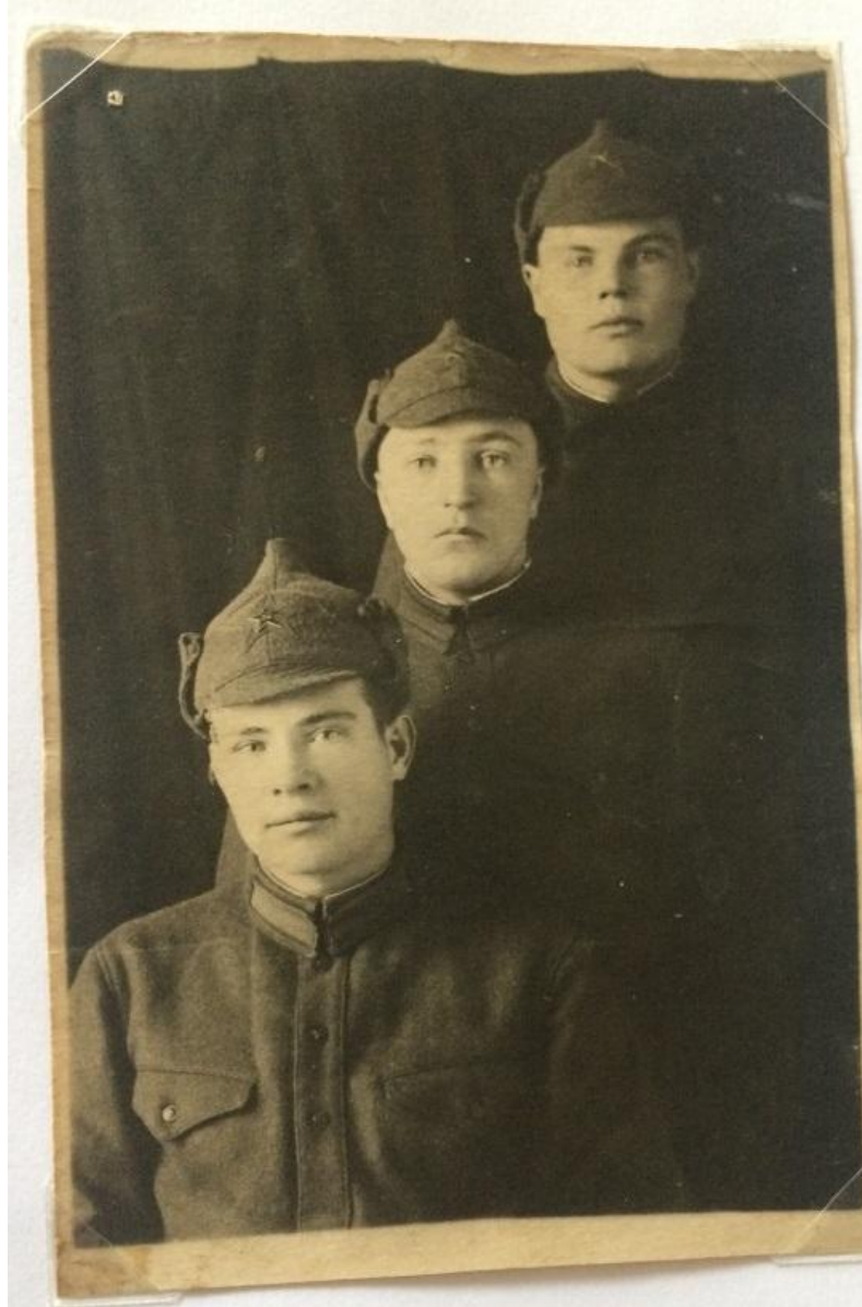
Выпуск полковой школы . Г. Красноярск, Военный городок. 1935 г.