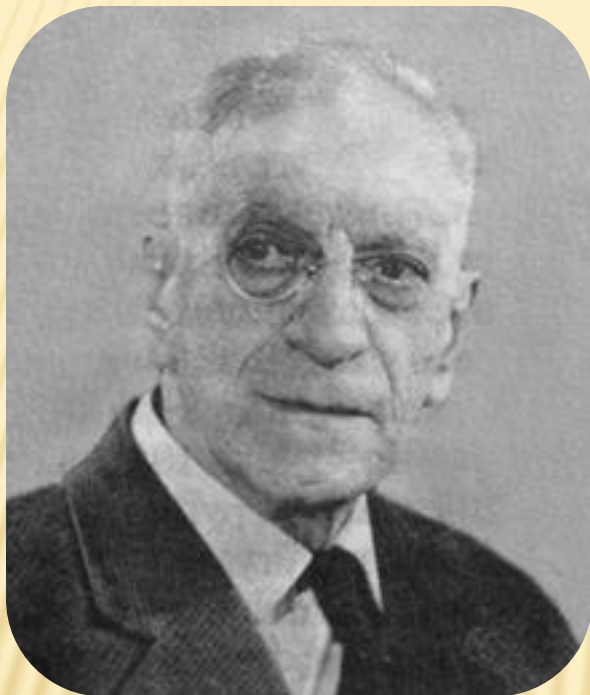
Евгений Иванович Катонин (1889 – 1984)

советский архитектор. Член Союза архитекторов, профессор, доктор архитектуры, действительный член Академии архитектуры Украинской ССР, заслуженный архитектор УССР.