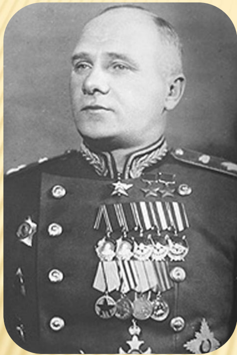
Семен Ильич Богданов (1894-1960) маршал бронетанковых войск, дважды Герой Советского Союза (1944, 1945).