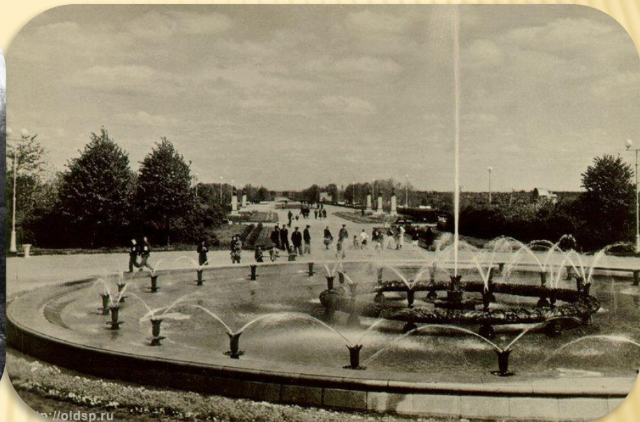
Фото сделано в 1953 – 1961 гг.

Парк был заложен осенью 1945 г. в честь победы советского народа в Великой Отечественной войне. Ранее на месте парка, находился Кирпично-пемзовый завод №1 – в годы войны его тоннельные печи использовались в качестве крематория. В память об этих страшных годах установлены памятник «Ротонда», памятный знак «Вагонетка», памятная доска, поминальный крест. Воронки от снарядов и карьеры кирпичного завода были превращены в небольшие пруды замысловатой формы, соединённые каналами.