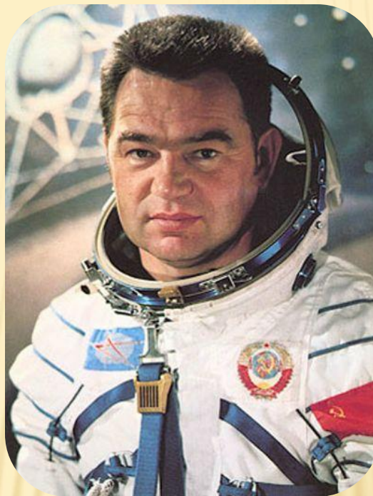
Георгий Михайлович Гречко советский космонавт