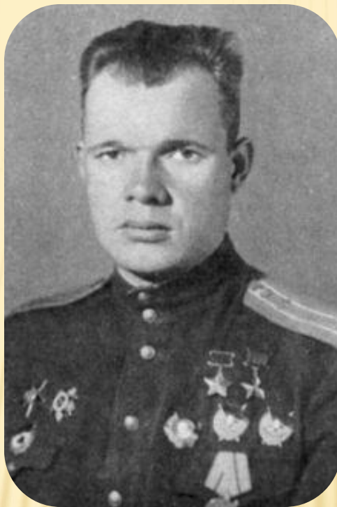
Виктор Максимович Голубев (1915-1945) летчик штурмовой авиации, дважды Герой Советского Союза (1942, 1943)