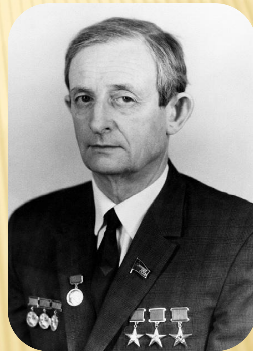
Юлий Борисович Харитон советский физик