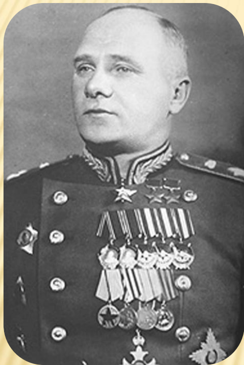
Семен Ильич Богданов (1894-1960) маршал бронетанковых войск, дважды Герой Советского Союза (1944, 1945).