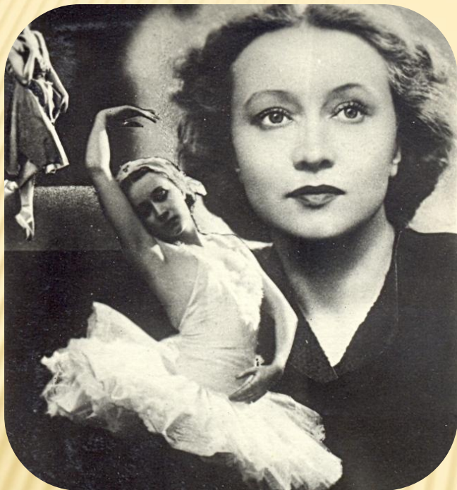
Галина Сергеевна Уланова выдающаяся русская балерина.