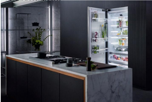
Полный ассортимент (20000158653)