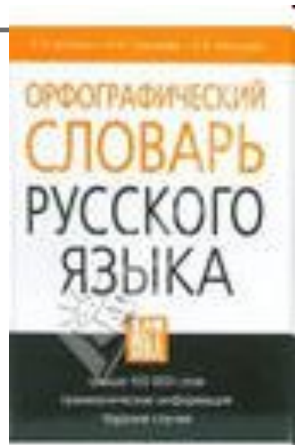
Орфографи- ческий словарь