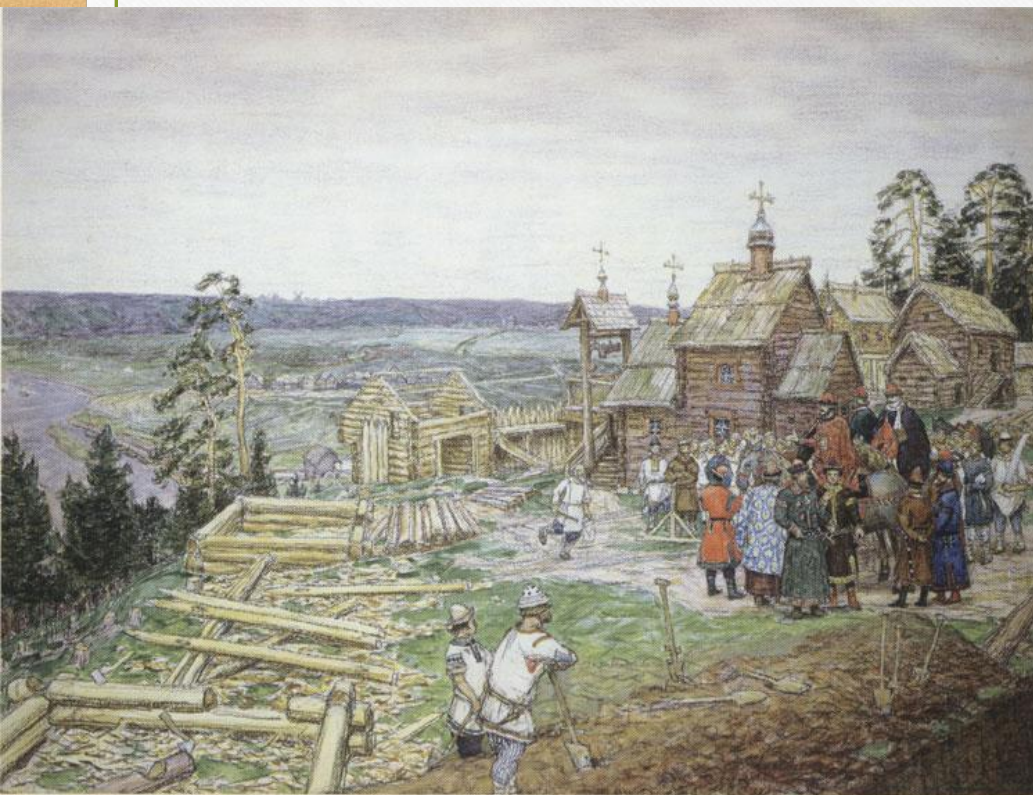
А. ВАСНЕЦОВ Освоение Москвы

Строил новые города (считается основателем Москвы — 1147 год)