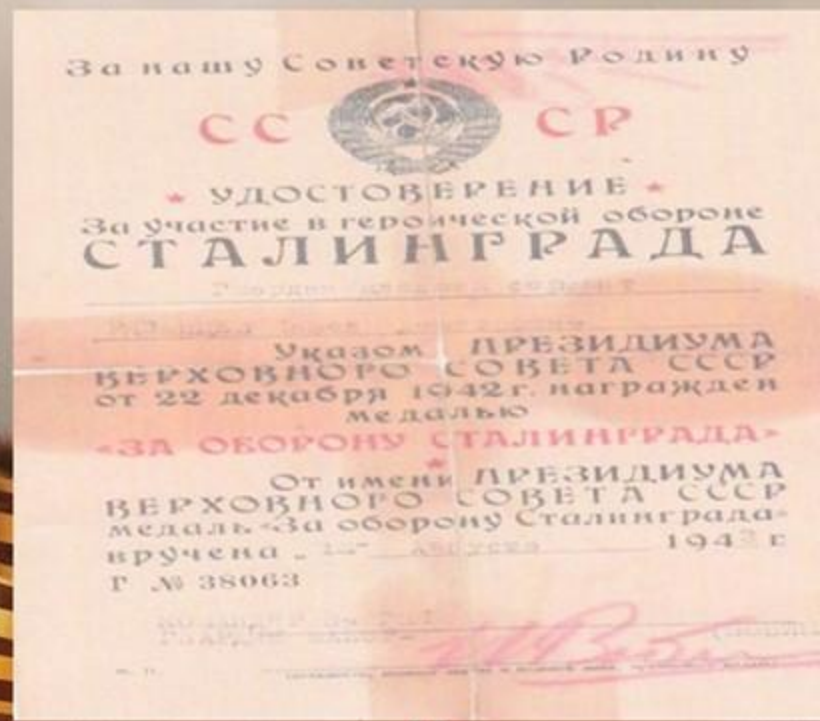
УЧАСТНИК СТАЛИНГРАДСКОЙ БИТВЫ