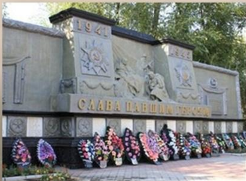
Братская могила в г. Котельники