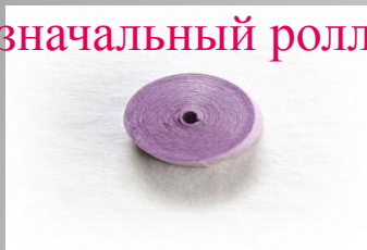
Базовая форма модуля