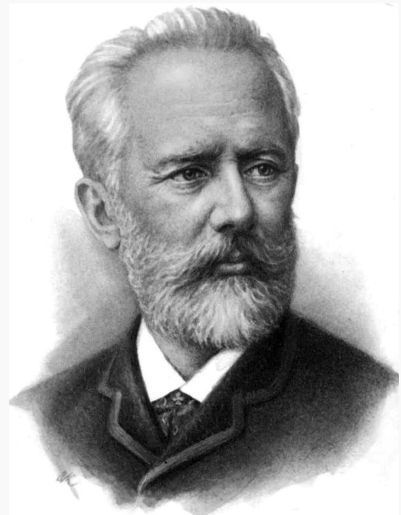
Чайковский Петр Ильич (1840 - 1893)