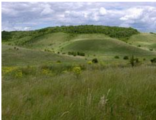
Участок Букреевы Бармы