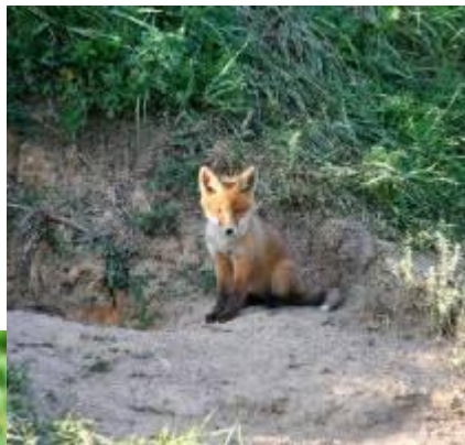
Лисенок у норы