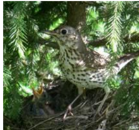
Певчий дрозд с птенцами