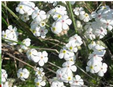
Проломник Козо- Полянского