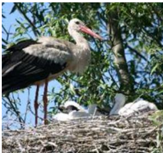
Белый аист с птенцами