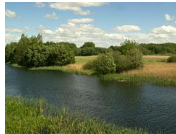
Участок Пойма Псла