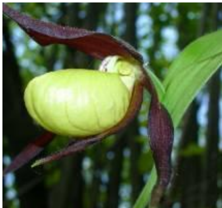
Венерин башмачок настоящий