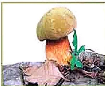
белый гриб (дубовый)