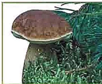
белый гриб (сосновый)