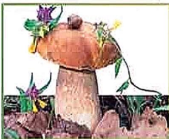
белый гриб (еловый)