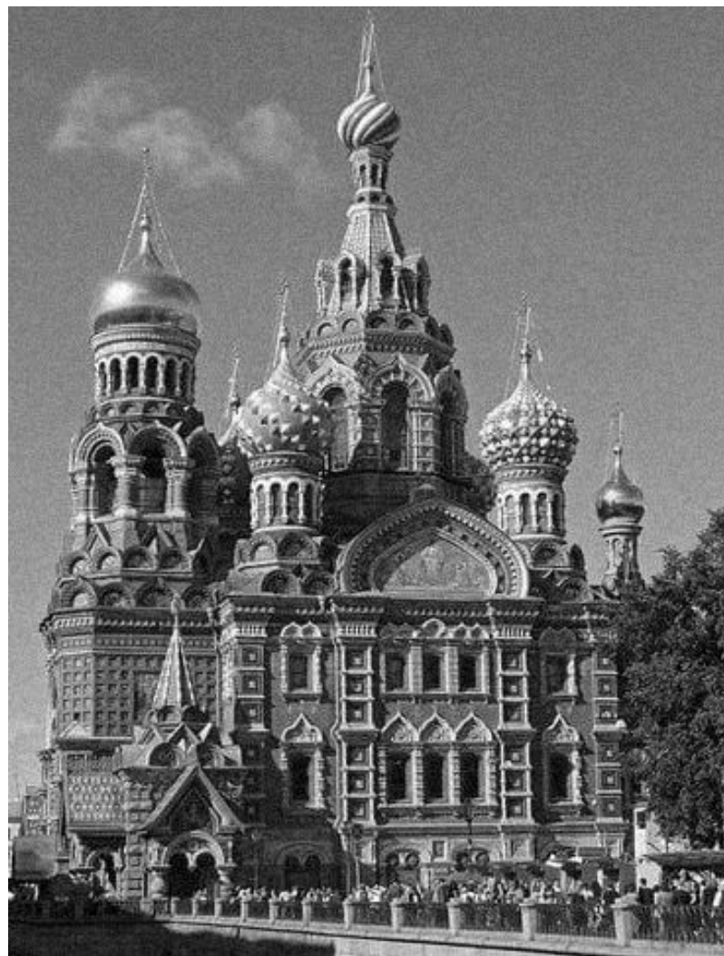
Храм Спаса-на- Крови