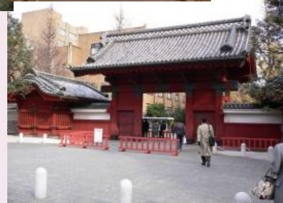
Вход в Токийский университет Холл, Токийский университет Токийский университет Старинный дуб, Токийский университет Красный вход, Токийский университет