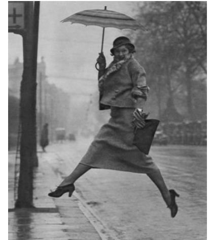
«The Puddle Jumper»

Изображение танца и беззаботных прогулок вприпрыжку ему удавалось лучше всего. Хотя будет неправильным так говорить про творения, среди которых сложно выделить лучшие. Было сделано невероятно много шикарных фотографий в разных уголках планеты и культовый кадр «The Puddle Jumper» – девушки, прыгающей с тротуара под дождем. Впоследствии его скопировал Ричард Аведон. Мартин снимал Фриду Кало и Грету Гарбо.