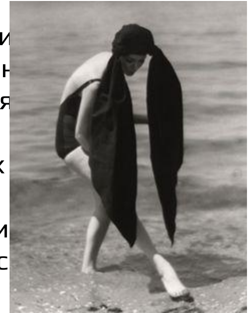
Tocado Halstor, 1962

К сожалению, талант Мункачи не всегда высоко ценили. Умер он в бедности, незаслуженно и преждевременно забытым. Технологии стали стремительно двигаться вперед, а его методы были заимствованы другими фотографами. После его смерти ни один из главных музеев Америки не захотел принять его творческое наследие. Когда интерес к работам гения фотографии проснулся у публики опять, они уже успели разойтись по различным коллекциям.