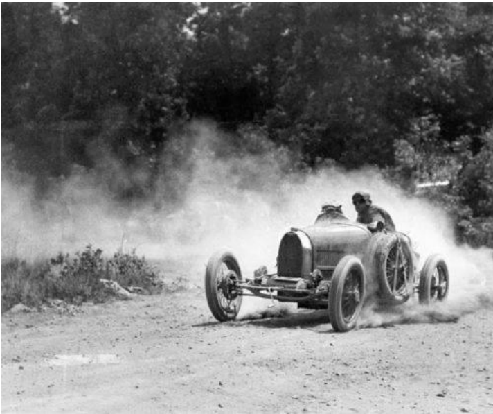
jacques henri lartigue cars