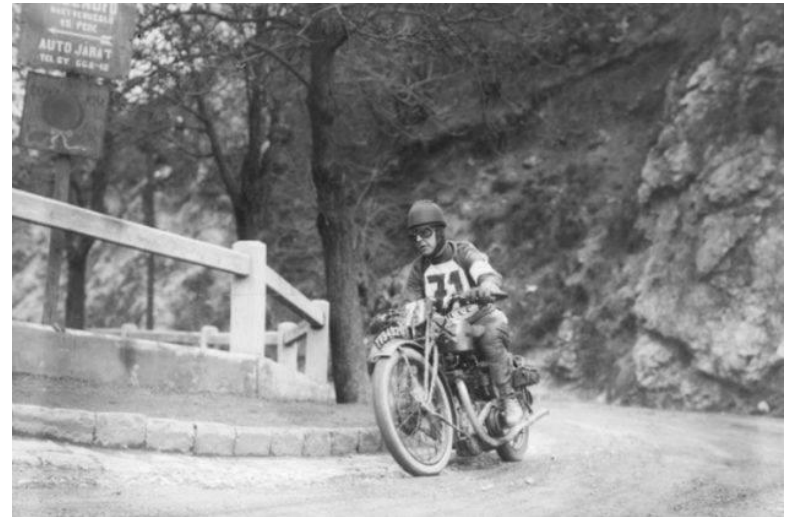
Мужчина на мотоцикле, 1929