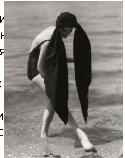
Tocado Halstor, 1962

К сожалению, талант Мункачи не всегда высоко ценили. Умер он в бедности, незаслуженно и преждевременно забытым. Технологии стали стремительно двигаться вперед, а его методы были заимствованы другими фотографами. После его смерти ни один из главных музеев Америки не захотел принять его творческое наследие. Когда интерес к работам гения фотографии проснулся у публики опять, они уже успели разойтись по различным коллекциям.