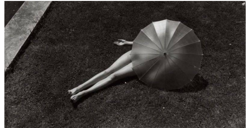
Nude with Parasol, Harper's Bazaar, 1935

Но одной из самых известных работ до сих пор остается «Три мальчика на озере Танганьика».