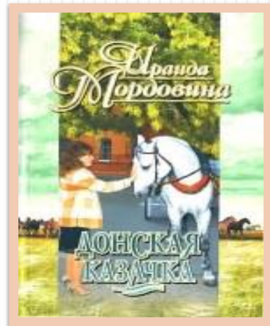
«Донская казачка» Ираиды Мордovиной