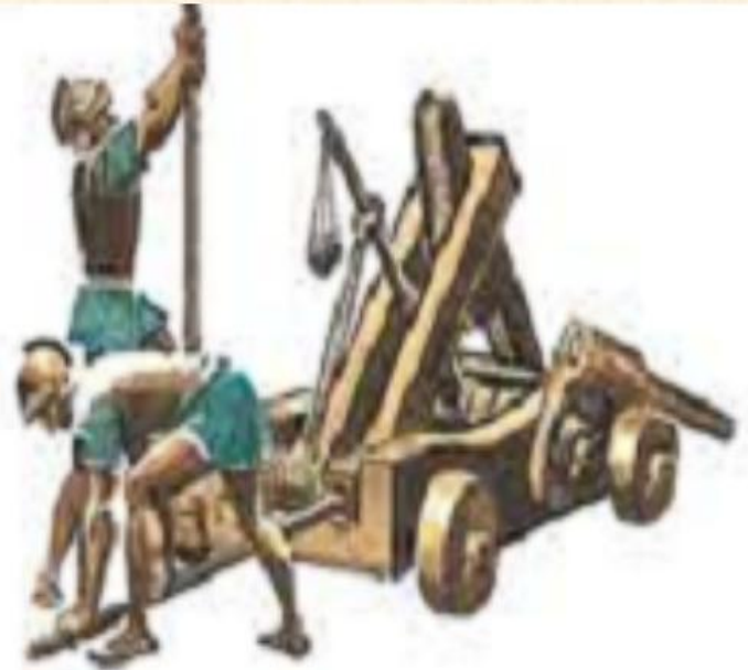
Машина для метания каменных ядер. Реконструкция.