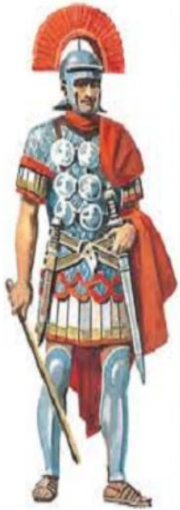
Командир римского отряда. Рисунок нашего времени.