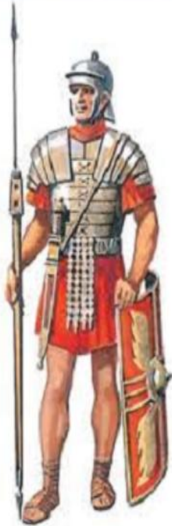
Римский воин-легионер. Рисунок нашего времени.