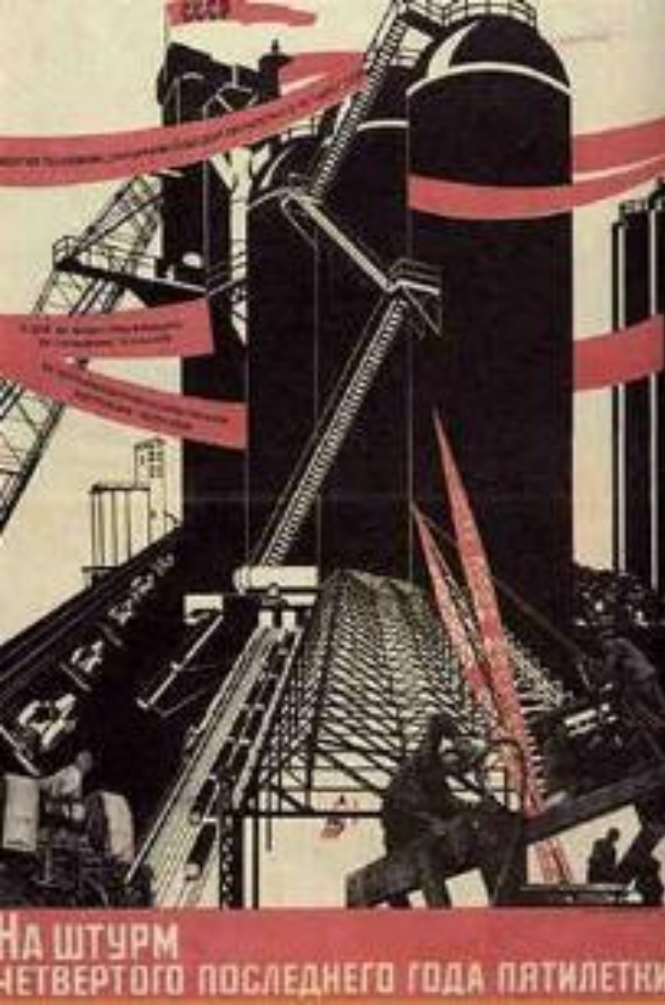
Н. Доглорук. Пропагандистский плакат.