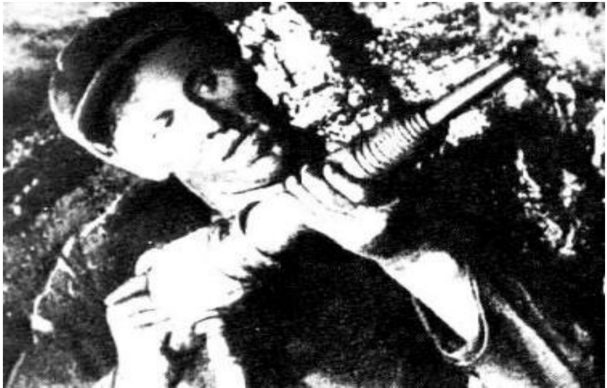
А.Стаханов в шахте

В 1935 г. А.Стаханов превысил норму добычи угля в 14 раз. Его почин распространился и на другие отрасли. Стахановцы получали до 2000 руб. в месяц и награды.