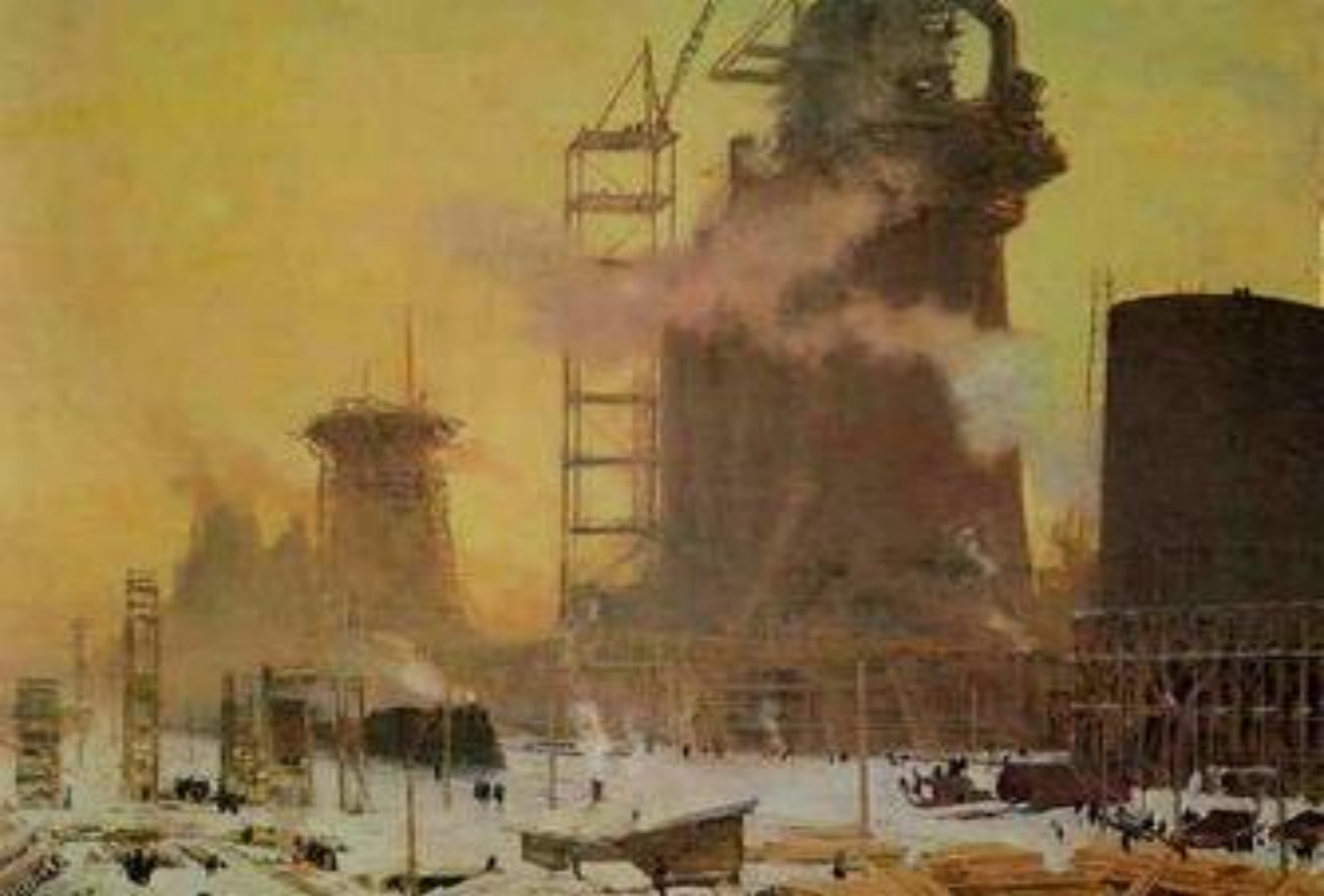
Я. Ромас. Утро Первой Пятилетки.