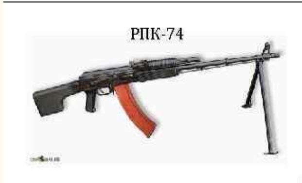
Снайперские винтовки Драгунова РПК и РПГ