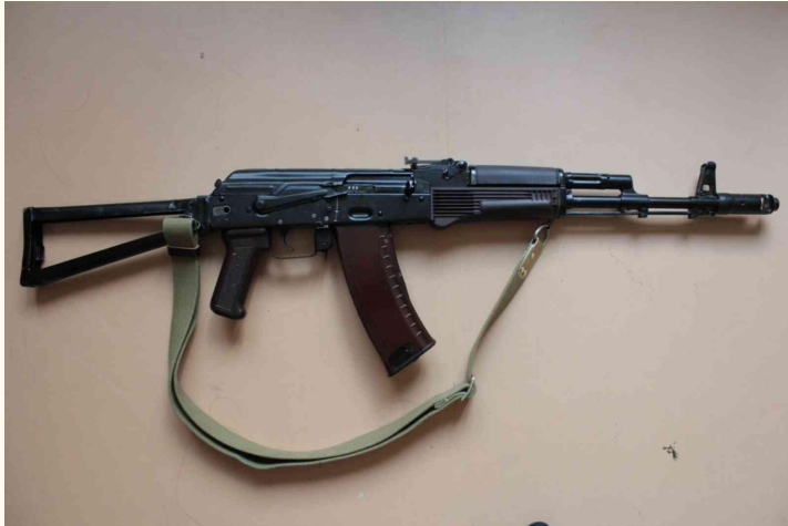
Автомат Калашникова системы АКС-74М калибра 5,45 мм