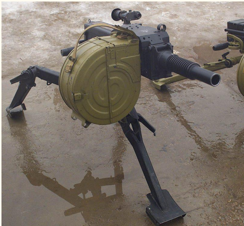
ВМП оснащенные гранатометами