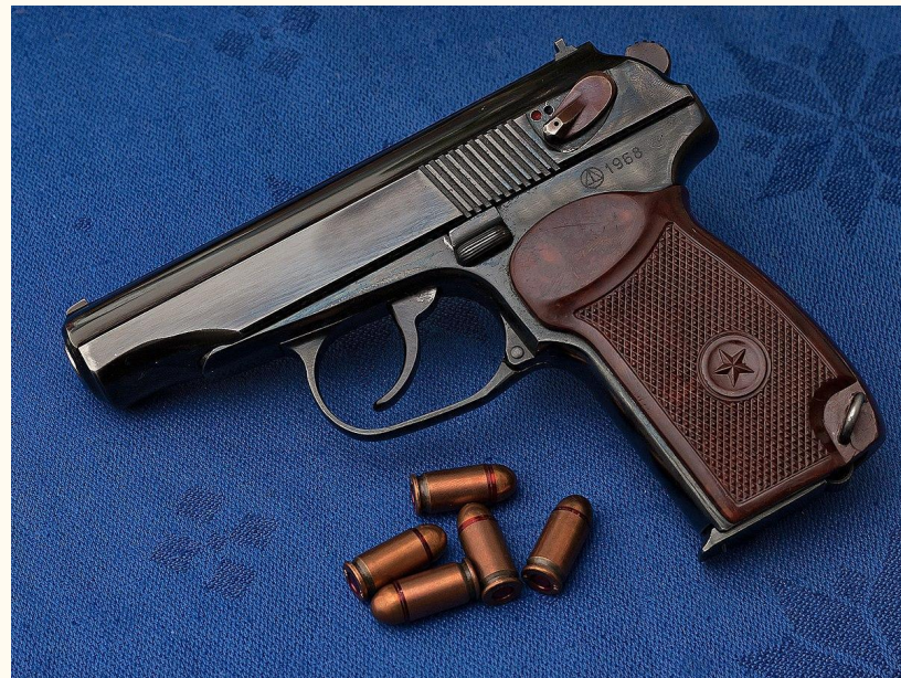
Пистолеты с системами ПМ