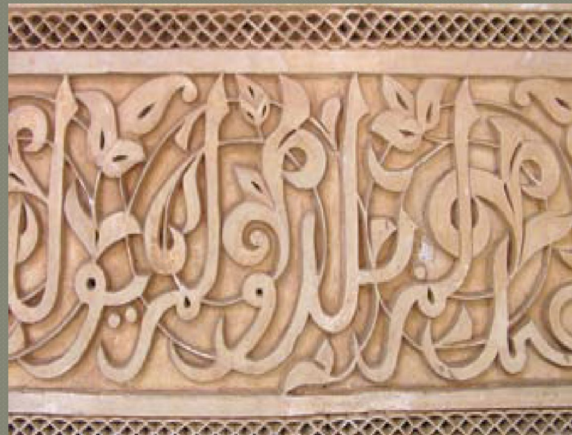
Деталь арочного свода.