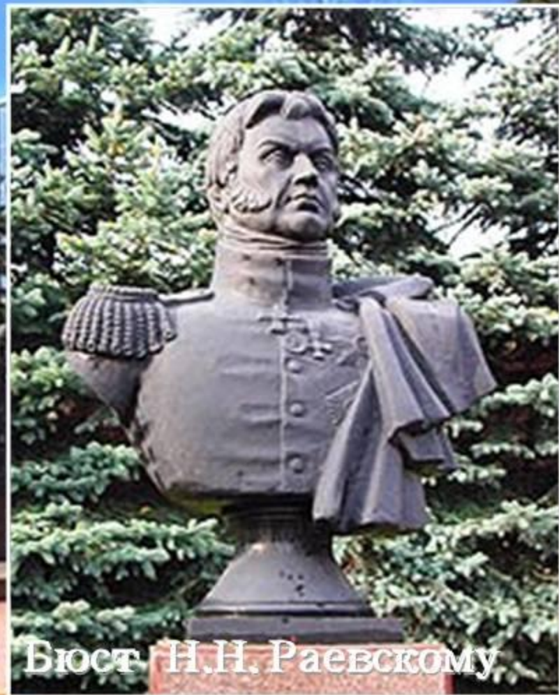
Бюст Н.Н. Раевскому