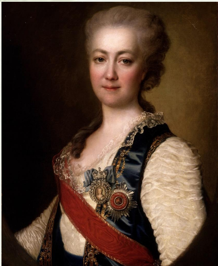
Екатерина Романовна Дашкова

29 ноября – День рождения буквы Ё. 29 ноября 1783 года состоялось одно из первых заседаний Академии Российской словесности с участием её директора – княгини Екатерины Дашковой, а также писателей Фонвизина и Державина. Екатерина Романовна предложила заменить обозначение звука «ю» в азбуке одной новой буквой «Ё» с двумя точками сверху. Доводы Дашковой показались академикам убедительными, и вскоре её предложение было утверждено общим собранием Академии.