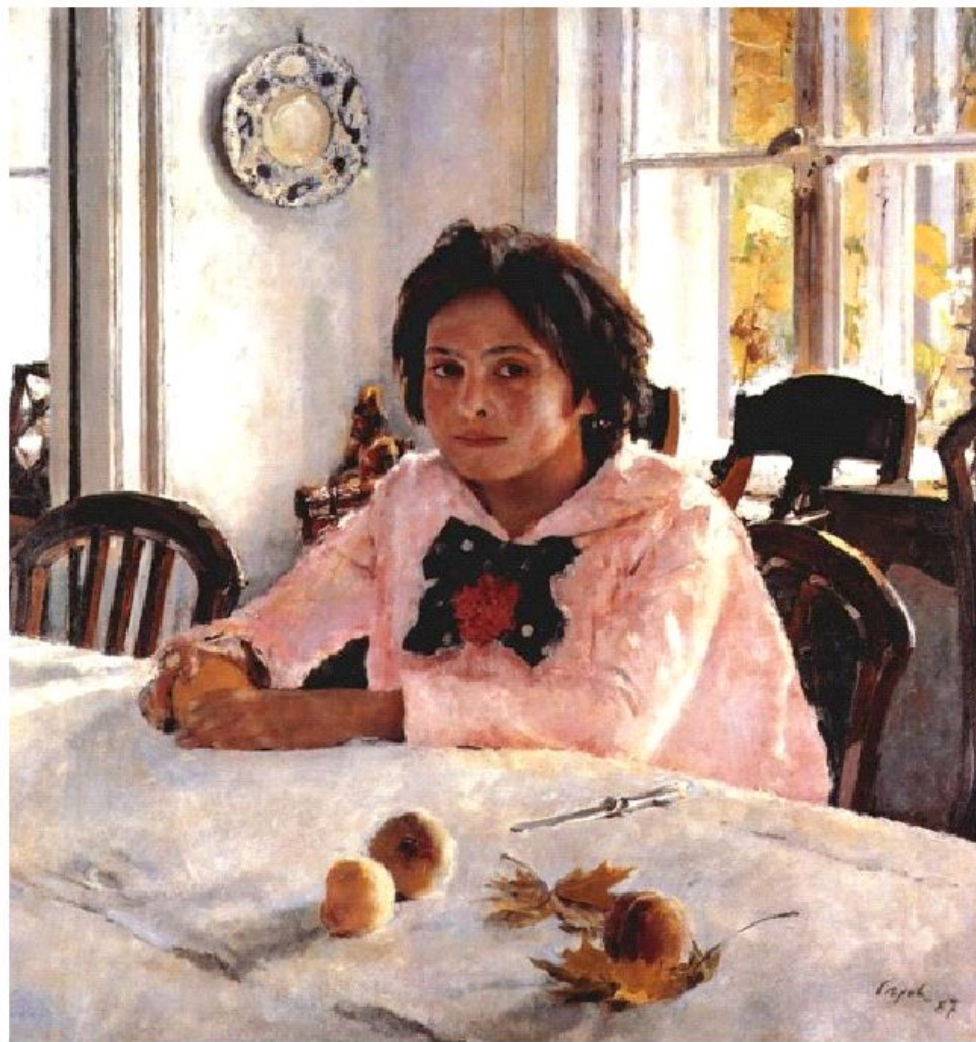
В. Серов «Девочка с персиками»