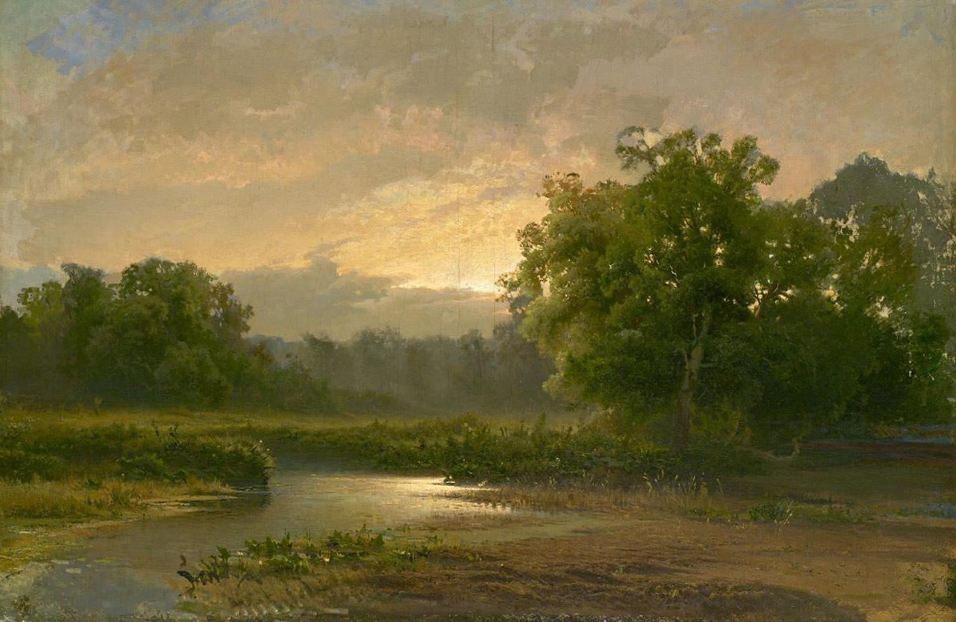
Ф. Васильев «На закате»