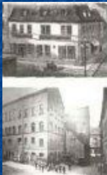
Дом Шумана в Цвиккау