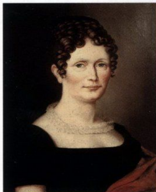
Robert Schumanns Mutter, Christiane Schumann, geb. Schnabel (um 1767–1836).