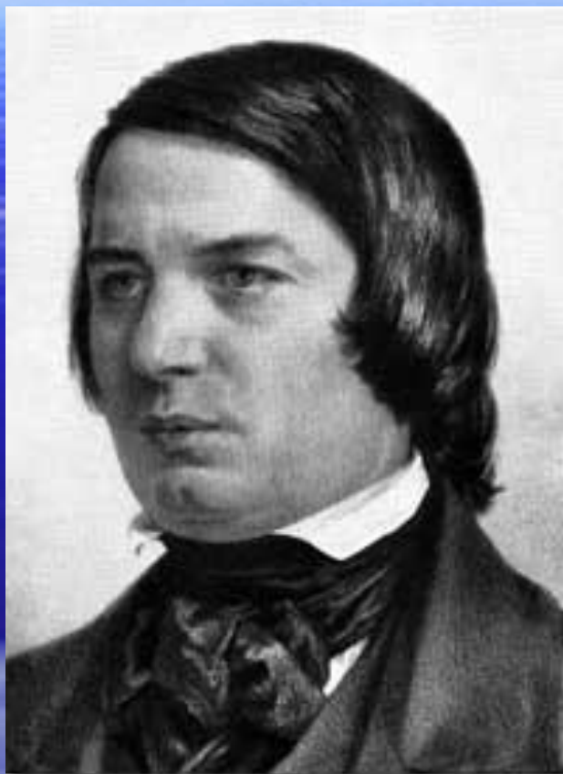
Портрет Роберта Шумана, рисунок Адольфа фон Менцеля 1850 года