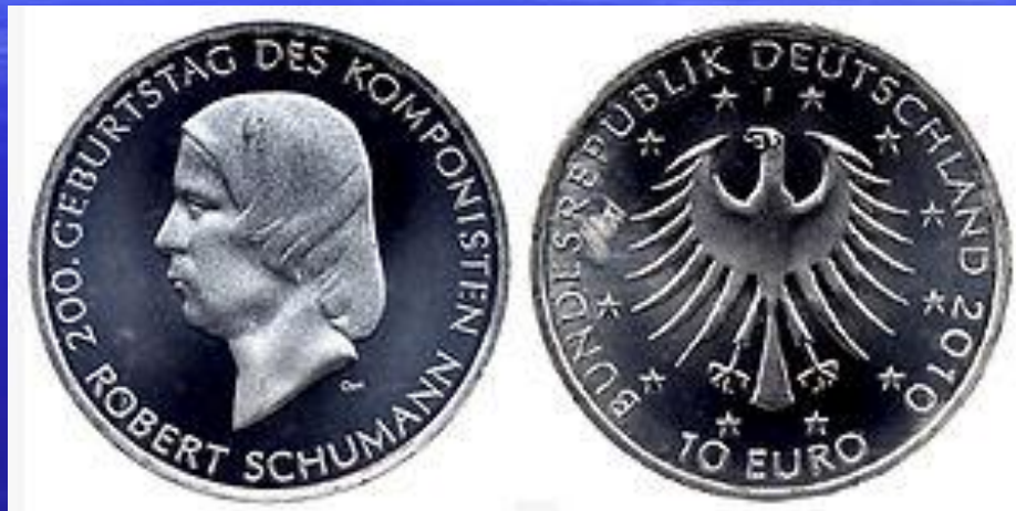
К 200-летию со дня рождения композитора (2010) в ФРГ была выпущена памятная серебряная монета номиналом 10 евро