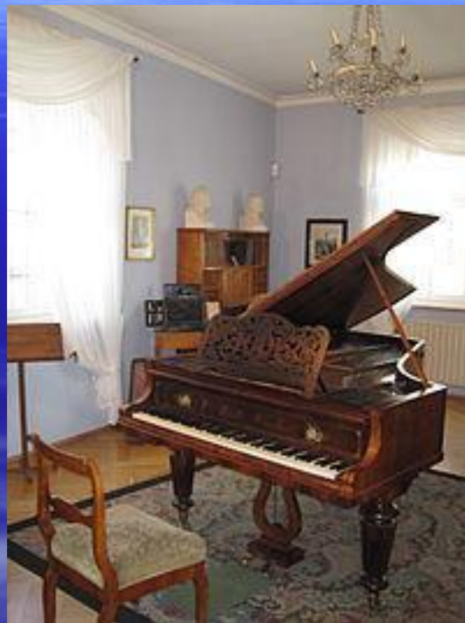
Музыкальная комната композитора в музее Шумана в Цвиккау