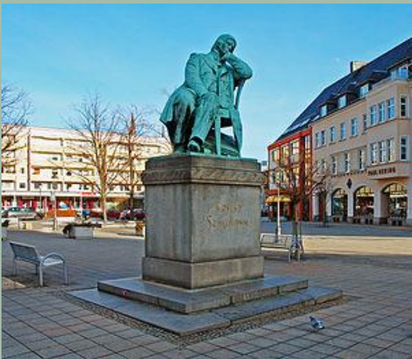
Памятник Р. Шуману в Цвиккау