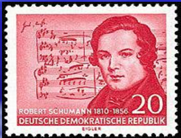
Почтовая марка ГДР Посвящённая Р. Шуману