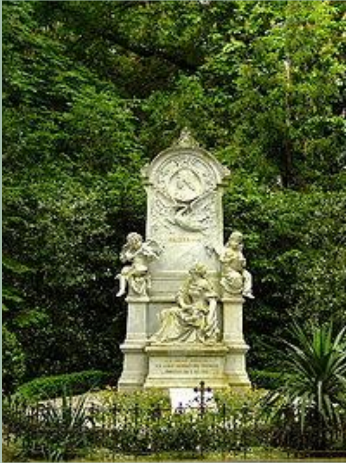
Могила Роберта и Клары Шуман