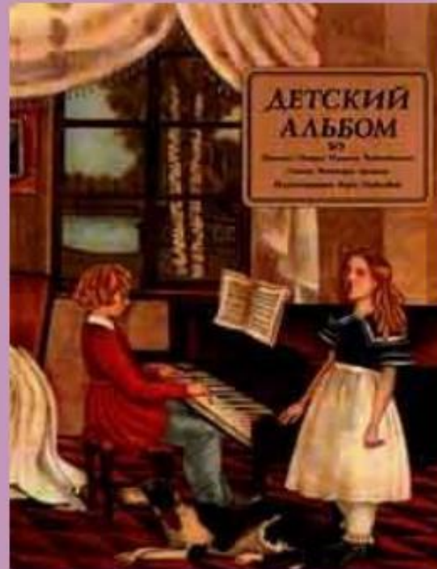
Обложка выпуска нот 1976 г.