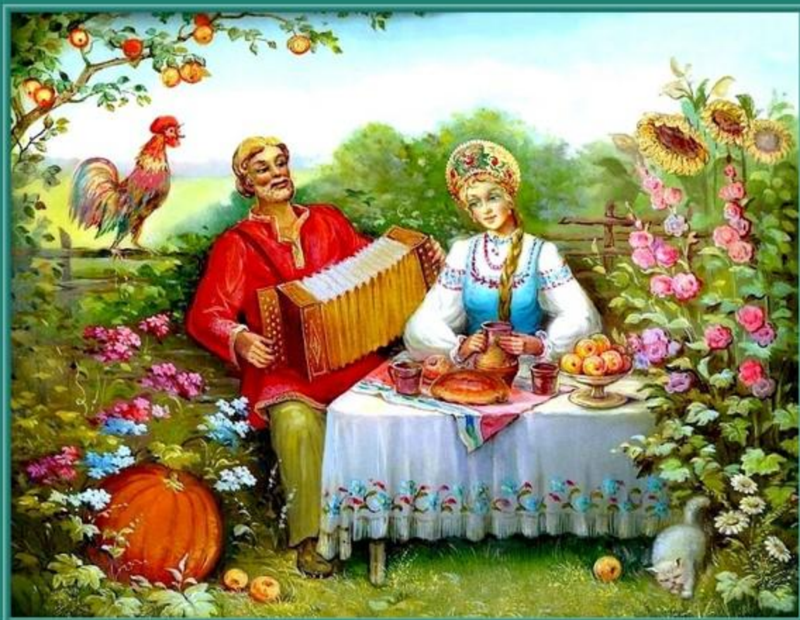
П. Чайковский. «Камаринская»