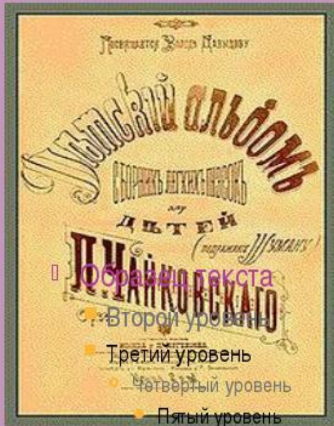
Обложка первого выпуска нот «Детского альбома»