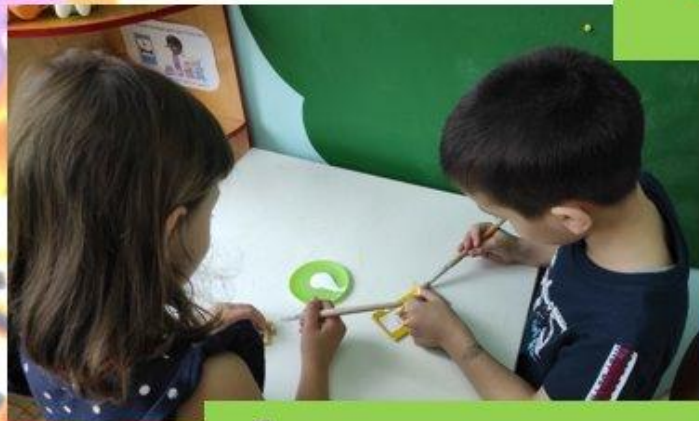
«Лечение» расклеившихся пазлов

Легкие поломки договорились «лечить» самостоятельно, при помощи воспитателя, в сложных случаях обращаться к родителям.