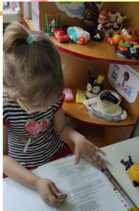
«Лечение» изрисованной книжки

Так же был затронут вопрос куда деть сломанные игрушки или порванные книжки, дети вспомнили мультфильм «Доктор Плюшева» и предложили создать в группе мини-пункт клиники для сломанных игрушек.