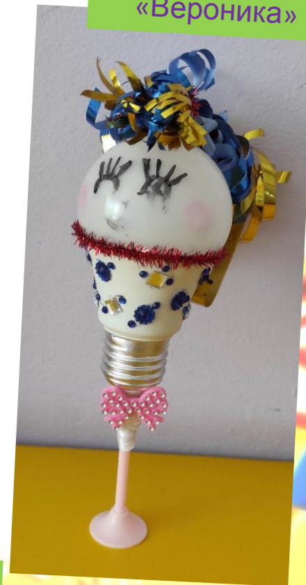
Умная станция «Вероника»