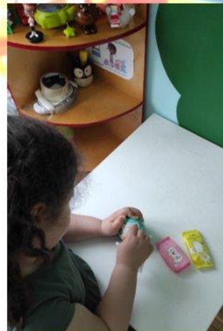
«Лечение» испачканной клеем игрушки