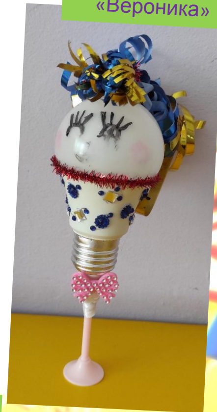
Умная станция «Вероника»