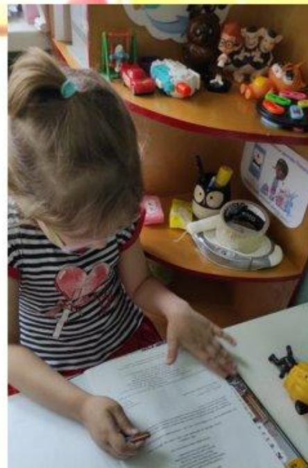
«Лечение» изрисованной книжки

Так же был затронут вопрос куда деть сломанные игрушки или порванные книжки, дети вспомнили мультфильм «Доктор Плюшева» и предложили создать в группе мини-пункт клиники для сломанных игрушек.