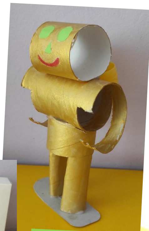
Робот для уборки игрушек