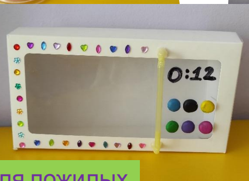
Микроволновка для пожилых (большие умные кнопки)