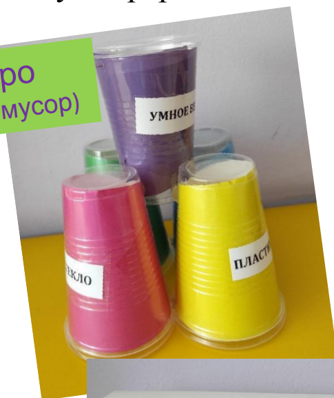
Умное ведро (само сортирует мусор)

В реальной жизни дети не могут повлиять на свалки техники, поэтому был разработан мини-проект «Я инженер», в ходе которого ребята придумали несколько идей, как став взрослыми они смогут переработать технику, которая была сломана.