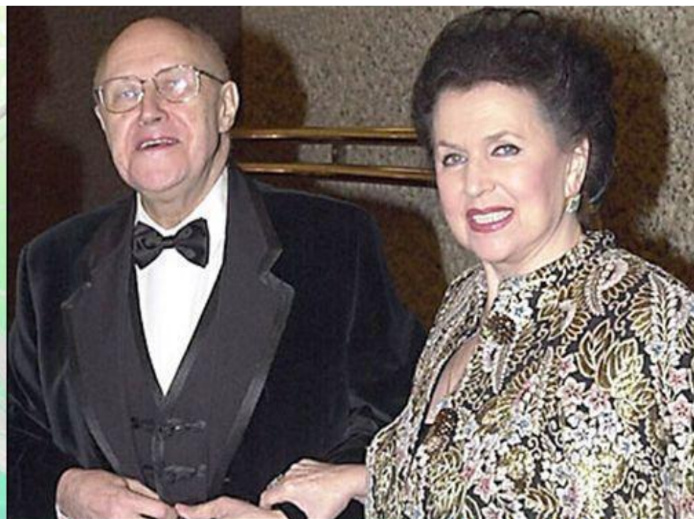
Мстислав Ростропович Галина Вишневская