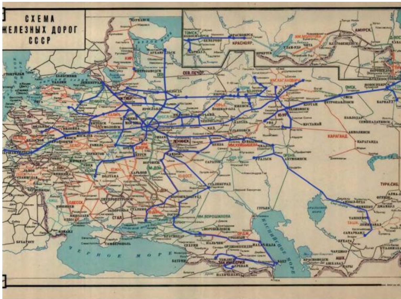
Маршруты военно-санитарного поезда ВСП-312 в годы Великой Отечественной войны