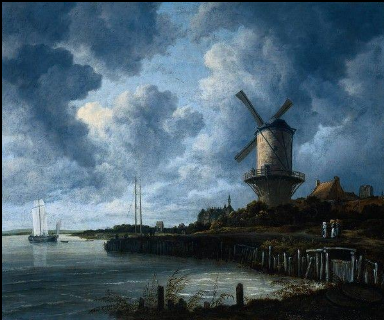
И. Иттен. Пейзаж с мельницей.