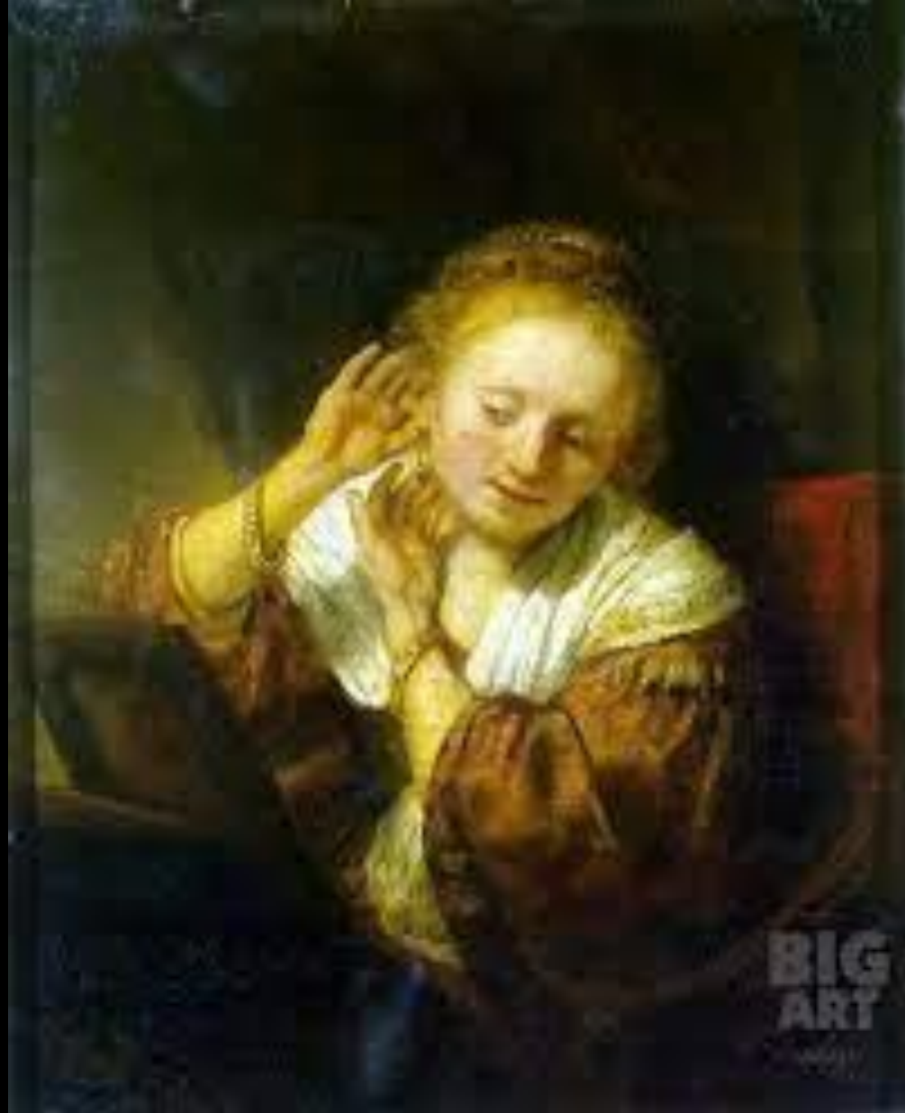
Рембрандт В. Р. Молодая женщина, примеряющая серьги.