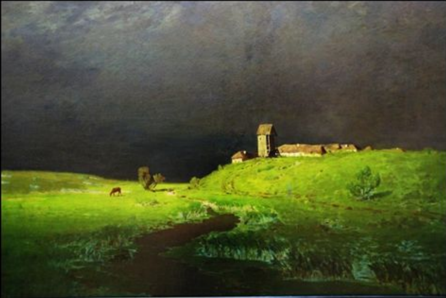
А. Куинджи. После дождя.