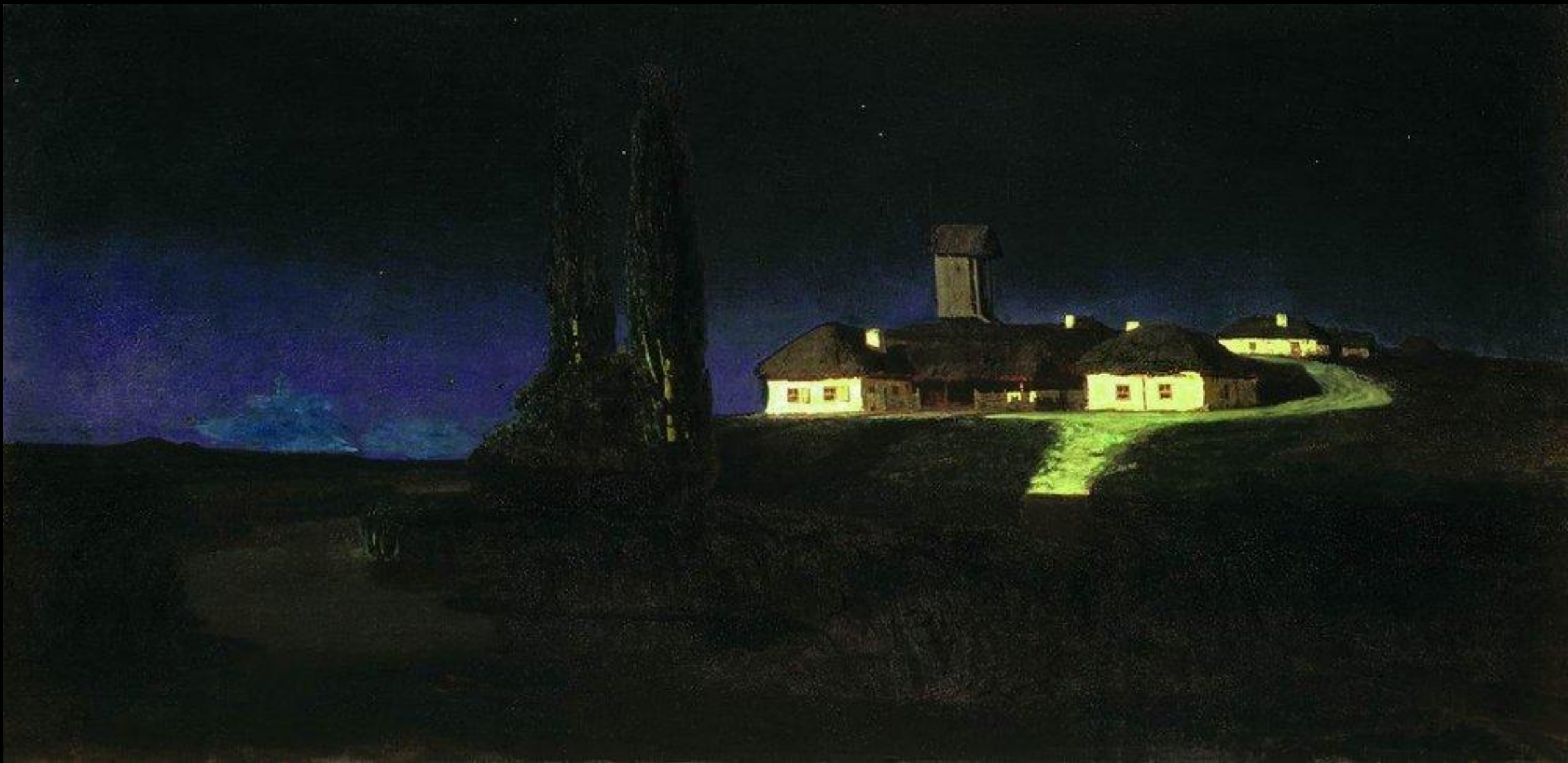
А. Куинджи. Украинская ночь.