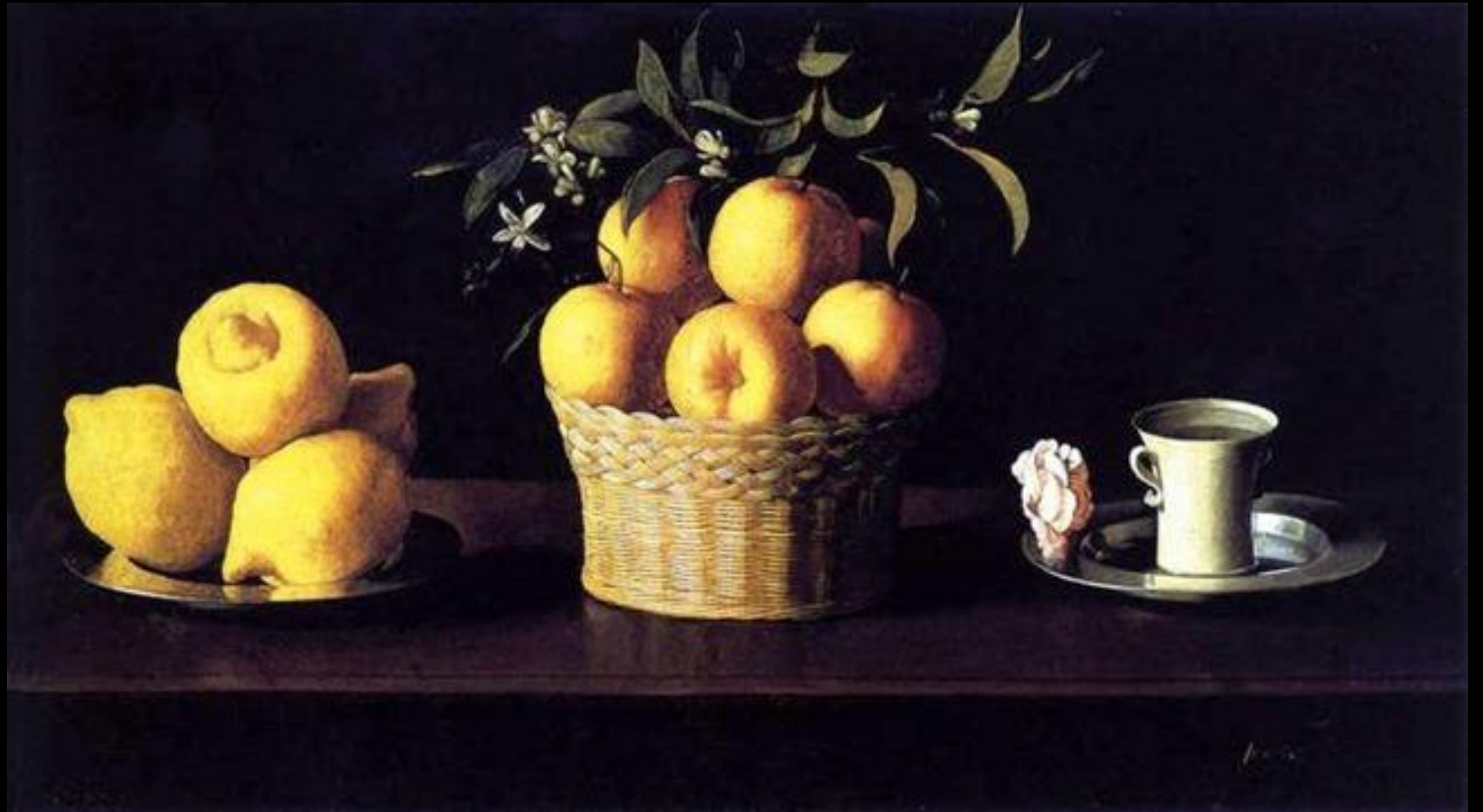
Ф. Сурбаран. Натюрморт