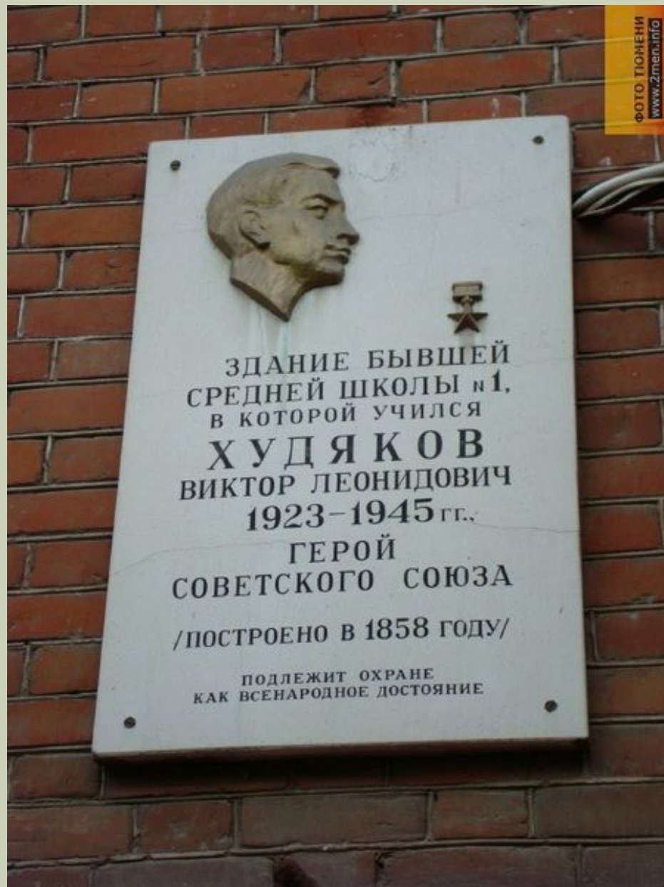
Памятная доска на здании школы №1, Тюмень.

Именем Героя названы улица и школа № 1 в городе Тюмени, а также моторный траулер. В посёлке Русское и на фасаде корпуса Тюменского государственного университета установлены мемориальные доски.