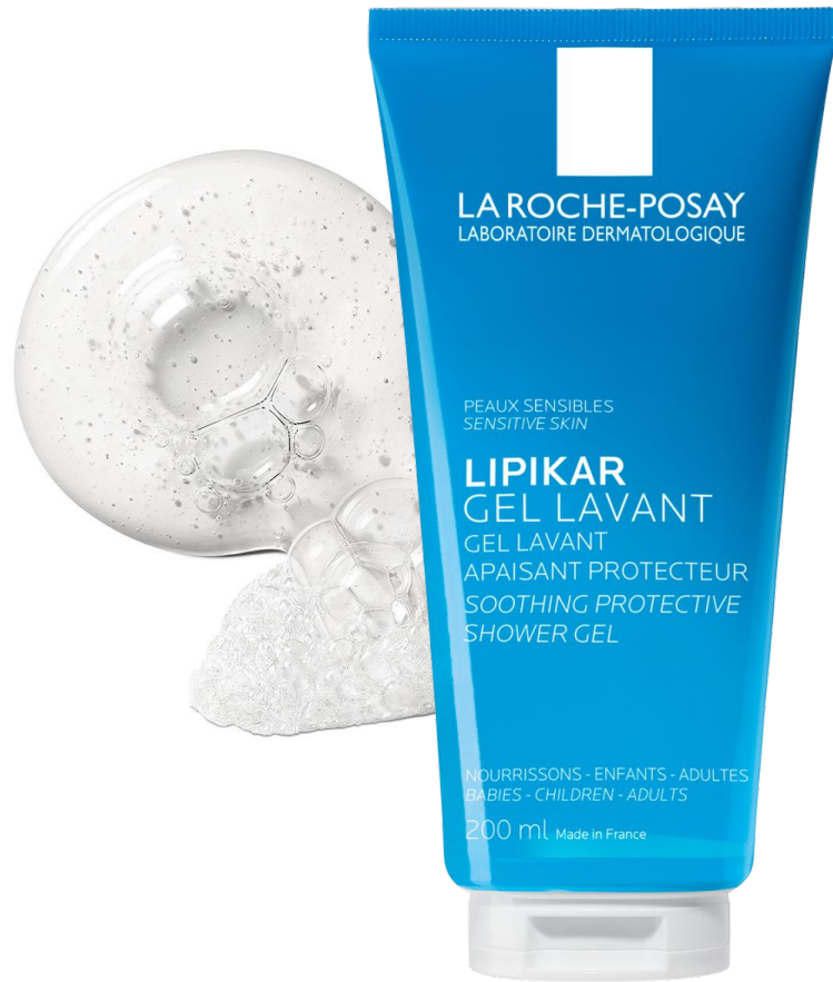
Ліпікар Очищувальний гель для ванни та душу для немовлят, дітей та дорослих