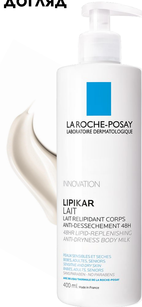
Ліпікар Молочко Ліпідовідновлюючий зволожуючий засіб для немовлят, дітей та дорослих