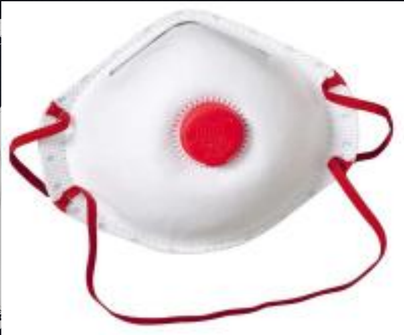
Противопыльная тканевая маска