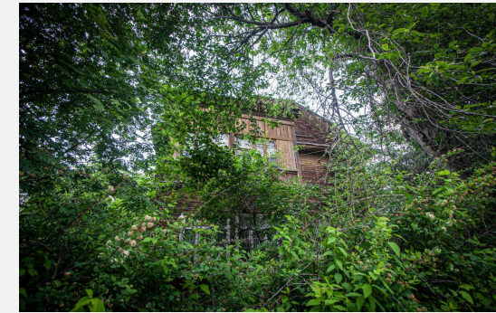
Озеленение «Красного Просвещенца»