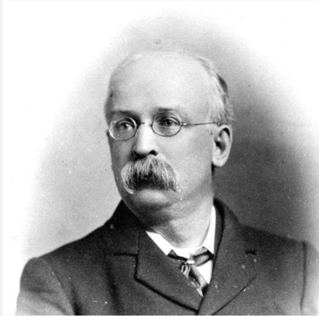
Эбенизер Говард, автор концепции города-сада